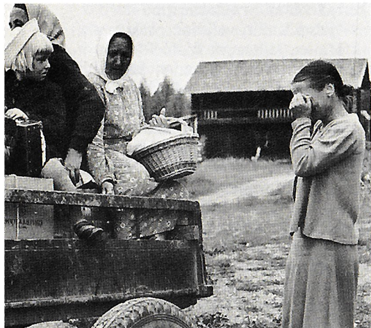
Evakot lähdössä Oitista takaisin kotiin Karjalaan heinäkuussa 1941.

Kuunarin sittemmin matkatessa Panaman lipun alla Lontooseen sen rungossa todettiin vuoto. Puutavaralastinsa varaan vajonneena se joutui palaamaan Turkuun. Seurasi 19 alenuksen vuotta hylkynä eri puolilla Turun saaristoa. Tänä päivänä kuunari on Porin Reposaareissa vanhojen puulaivojen toimintakeskuksessa osin jo entistettynä.