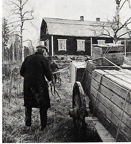
Siirtolaisperhe saapumassa pitkältä evakkomatkalta kotiin Sommeen kylään Viipurin maalaiskuntaan.

Johannes Virolainen on osoittanut kirjansa kunniantekona niille yli