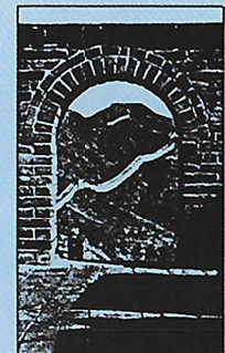
Jotkut historioitsijat ovat arvelleet, että suuren Kiinan muurin rakentaminen ei johtunut pelkästään halusta pitää maahantunkeutujat loitolla. Valtava urakka työllisti tuhansia kotiutettuja sotilaita.

Ensimmäisen keisarin itsevaltainen hallitsemistapa oli tiukkaa ja tehokasta. Pian hänen kuolemansa jälkeen alkoi kuitenkin katkera taistelu vallasta. Li Shu vangittiin, ja häntä kidutettiin. Lopulta hänet katkaistiin keskeltä. Kansalaiset kapinoivat, ja Kiina jakautui jälleen kerran.