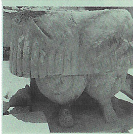
Tarxienin temppelin kaksijäpuolimittisestä äitijumalattaren patsaasta on jäljellä vain alaosa. Alkuperäinen on museossa.