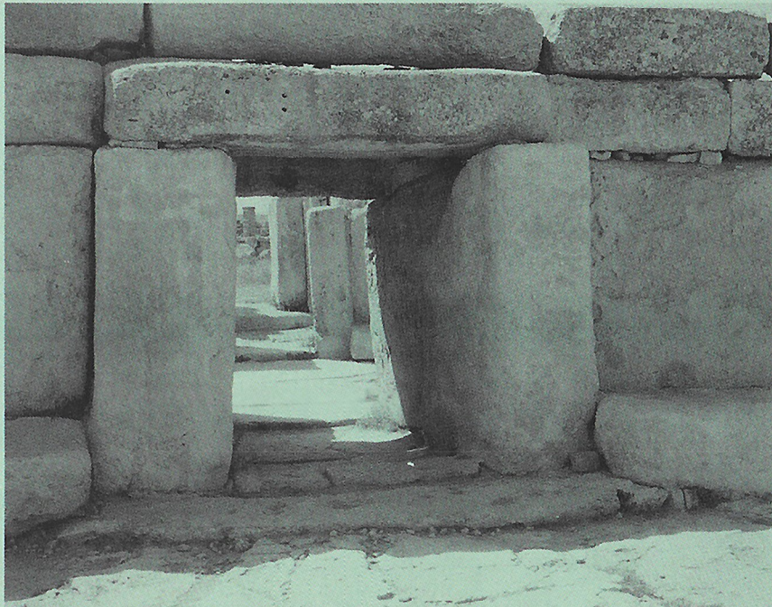
Hagar Qimin temppelin julkisivun oviaukkoineen. Muurilla on korkeutta kolme metriä.

Maltalle ja sen sisarsaarelle Gozolle nousi kymmeniä ylväitä kivitemppeleitä, joista viimeisimmät ja hienostuneimmat rakennettiin vuoden 2 500 paikkeilla eKr. — ennen Egyptin suuria pyramideja tai Stonehengen aurinkokultin palvontakeskusta Englannissa.