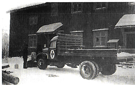
Volvo ambulanssi ja kenttäsairaala.