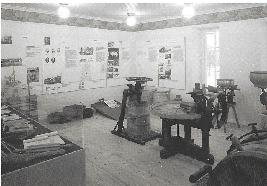
Kartano- ja kylämeijerivälineistöä 1850—1900

Kun koneet ja laitteet on onnistuttu sijoittamaan toiminnallisesti oikeaan paikkaansa, on saatu syntymään vaikutelma siitä, että työt meijerissä ovat juuri pysähtyneet, koneet ja lattiat pesty ja lähdetty kotiin. □