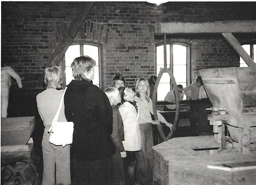
Koululaisryhmä tutustumassa Tekniikan Museon myllyosastoon alkuperäisessä v. 1882 rakennetussa myllyrakennuksessa.

kosken länsirannalla sijaitsevaan entiseen myllyrakennukseen löytynyt alkuperäisen kaltainen myllykoneisto, joka asennettiin paikoilleen Vaasan Höyrymyllyn toimesta muiden sinne saatujen vanhojen myllykoneistojen ja -laitteiden ohessa. Tämä myllyosasto vihittiin keväällä 1974. Samanaikaisesti olivat valmisteilla C-halliin tuleva sähkötekniikan osasto ja ehkä kaikkein lähinnä Kajasteen sydäntä ollut osasto, nimittäin kaupungin vesilaitoksen oma näyttely, joka sijoitettiin vanhaan vesipumppurakennukseen. Helsingin kaupungin vesilaitoksen 100-vuotisjuhlavuonna keväällä 1976 saatettiinkin avata laitoksen juhlanäyttely. Valitettavasti on todettava sekä myllyosaston että vesilaitososaston menneinä vuosina tulleen täydellistä saneerausta ja korjausta vaati-vaan kuntoon.