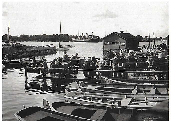
Matonpesulaituri Munkkisaarella. Valok. Signe Brander 1907.