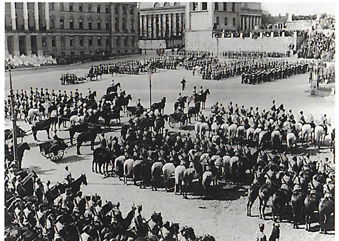
Puolustuslaitoksen vuosipäivän paraati 16. 5. 1920.