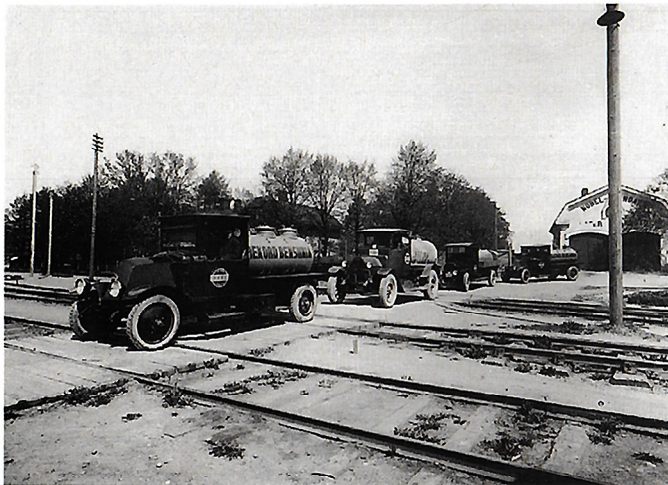
Nobel Standardin säiliöautoja tulossa Sörnäisten varastolta. Valok. Eric Sundström 1926.

Museon oma dokumentointikuvaus edustaa näyttelyssä uudempaa valokuvasta. Museo tallentaa jatkuvasti ympäristöä, muutoksen alaisia kohteita ja nykyajan ilmiöitä. □