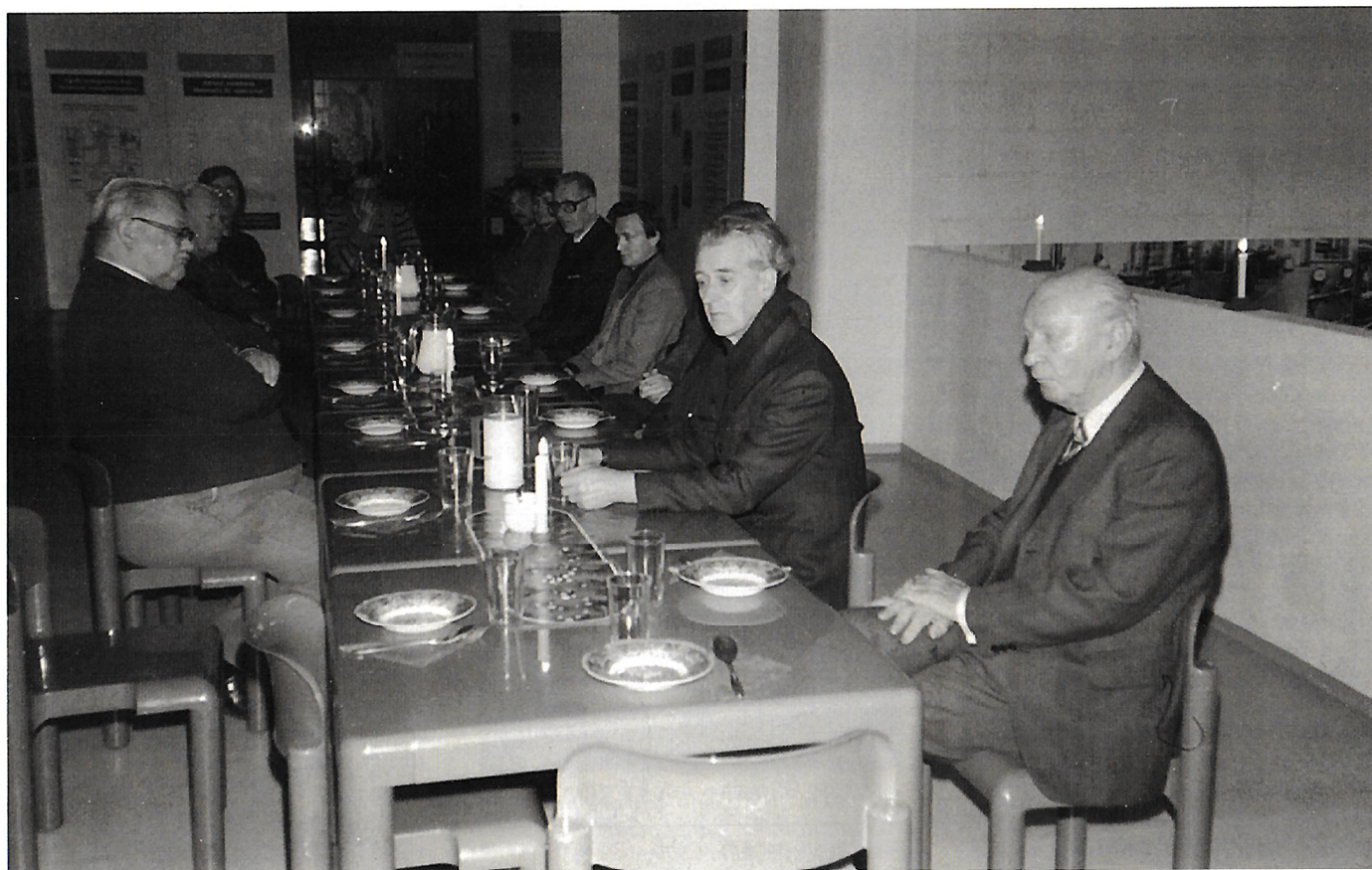
Talkoolaisia joulun alla 1984. Osa kuvassa näkyvistä veteraaneista on mukana vieläkin.

tukea odotetaan insinööreiltä ja heidän järjestöiltään.» Vähitellen säätiön valtuuskunnassa edustettujen yhteisöjen tuki museolle onkin vakiintunut, ja voidaan todeta, että esittämäni toivomukset ovat suurelta osalta toteutuneet vuodesta 1983 lähtien.