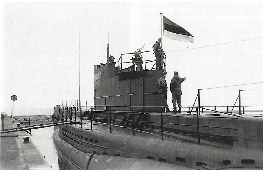
Viron lippu on nostettu sukellusvene Lembitin tankoon 27. 4. 1992 klo 12.

Tiistaiaamuna lähdimme itäsuuntaan Pietarin maantietä pitkin linja-autolla. Päämääränä oli Moen kylä lähellä Tapan rautatienrasteyskaupunkia; tasan sadan kilometrin matka.