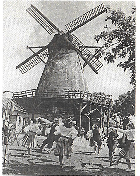
Kuressaaren ravintoloista hauskin on vanhassa tuulimyllyssä. Sen pihanurmella on hyvä panna toimeen »simman» eli tanssi-iltamat.