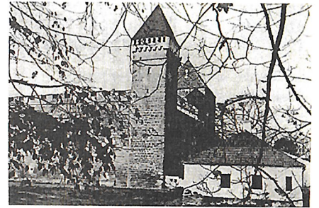
Kuressaaren piispanlinna on hyvin entistetty arkkitehtuurimuistomerkki. Sen sisällä on kotiseutumuseo ja konserttisali. Ja linnan varjoisalla sisäpihalla pidetään mm. Saarenmaan laulujuhlat.

Opiskelijan asutuseum , Burdenko 61, avoinna ti—la 11—16. Suuria museoita vaellettuaan kokee virkistykseksi pienessä mutta mukavassa käynnin. »Tudengimuseum» oli vielä pari vuotta sitten Leninin veljelle Dmitri Uljanoville omistettu, mutta Dmitrin tavarat on pakattu pois ja entisaikojen tarttolaisen opiskelijan irtaimisto tuotu sijaan.