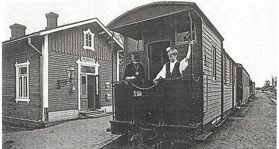
Minkiön asemalla Jokioisissa toimii kapearaidemuseo. Museota täydentää Minkiön ja Jokioisten asemien välillä kulkeva museojuna.