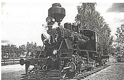
Karjaan asemalla on höyryveturi muistona entisistä ajoista. Kesäisin höyryjuna ◀ Ukko-Pekka liikennöi Hyvinkäälle.