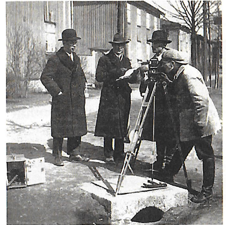
Kaupunkimittaus Helsingin Käpylässä v. 1929.

Näyttelyssä kävijöitä oli 20 aukiolopäivän aikana yhteensä 8200. Kart-