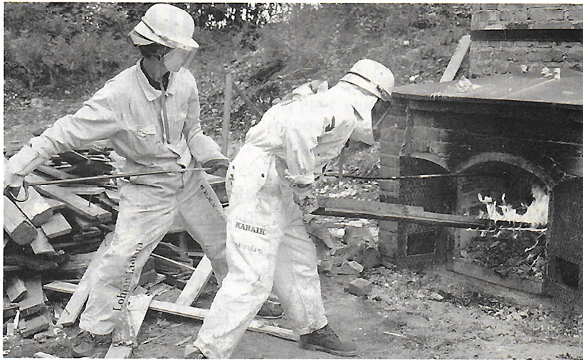
Kalkinpolttua Leineperissä perinteisin menetelmin.

Samassa tilaisuudessa julkistettiin ympäristöministeriön selvitys Leineperin ruukinalueen kehittämisen organisoinnista ja toteutuksesta, sekä museoviraston teettämä ruukin tutkimus- ja restaurointiraportti, Museoviraston rakennushistorian osaston raportteja 7. Leineperi sijaitsee Kullaan kunnassa Porin itäpuolella.