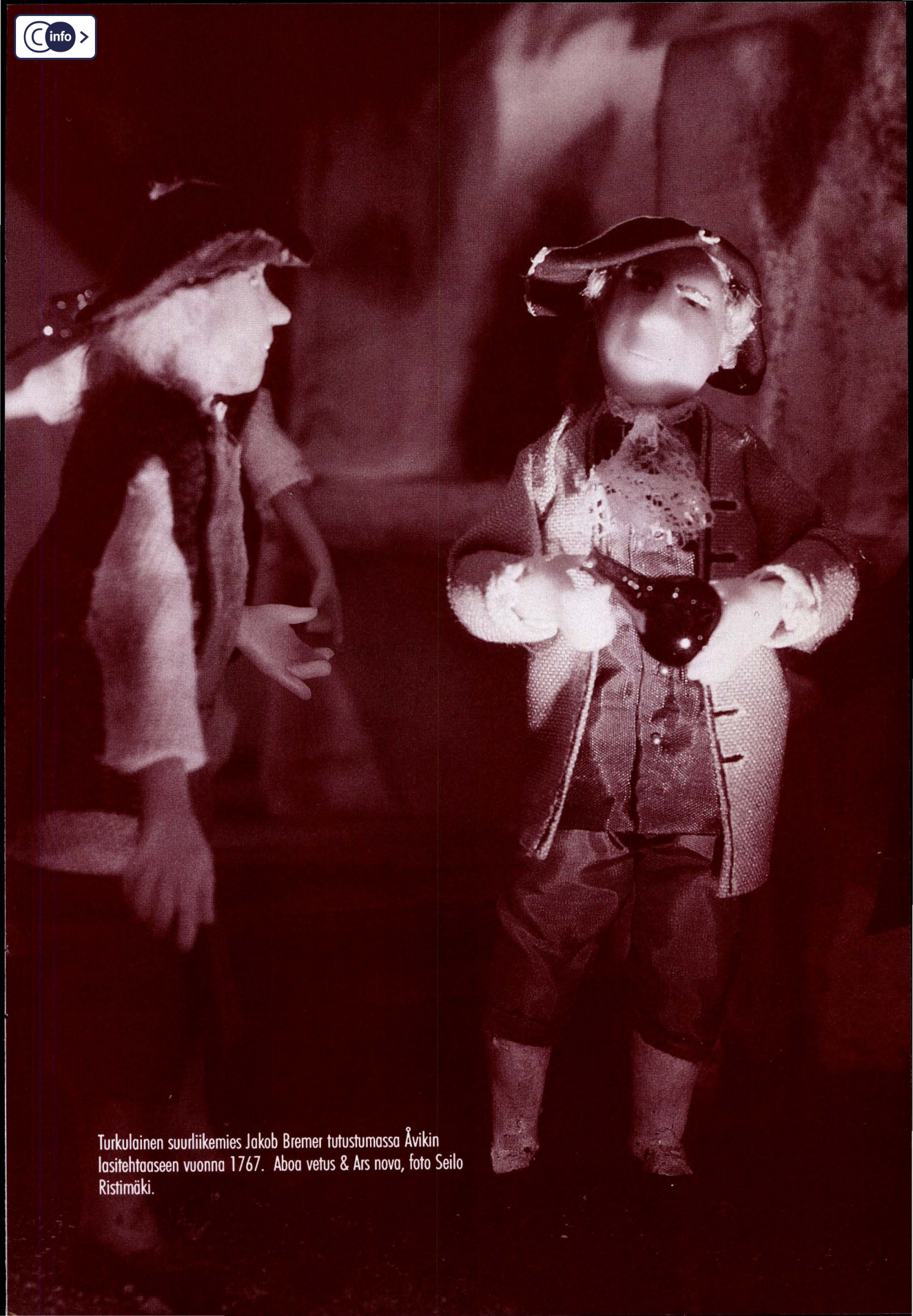
Turkulainen suurliikemies Jakob Bremer tutustumassa Åvikin lasitehtaaseen vuonna 1767.