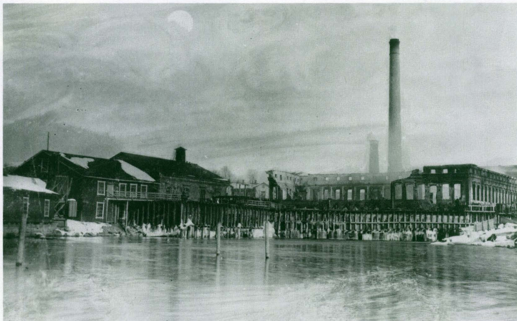
Vuoden 1901 suurpalo tuhosi pahoin Valkeakosken paperitehtaan. Osa tehdaskompleksin rakennuksista oli peräisin 1870-luvun alusta. Tiiltä olivat lähes ainoastaan ulkoseinät.

tautui ovesta kosken yli Kemmon hiomoon vievälle sillalle.