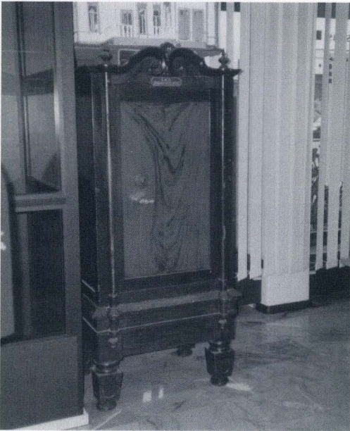
Turkulainen kaappikaunotar koristaa Meritan Orimattilan konttorin pankkisalia. Kaappi on tietävästi tullut Orimattilan Säästöpankin Mallusjoen konttorista.