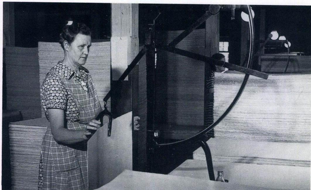
Jokainen arkki punnittiin erikseen ja lajiteltiin.