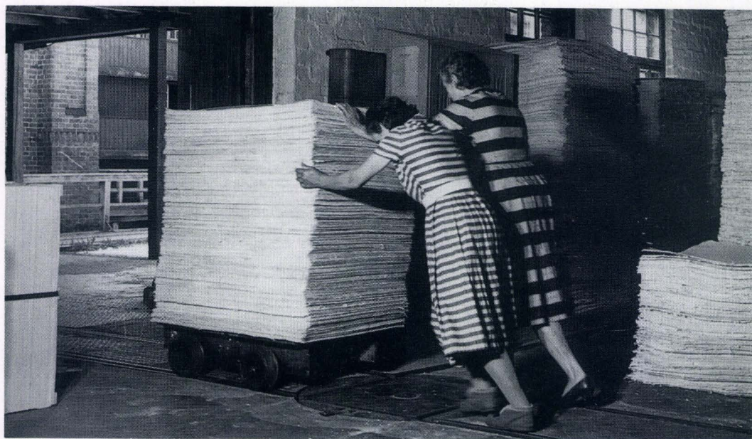
Pahviarkeja siirretään kiillotussalista lajitteluun.