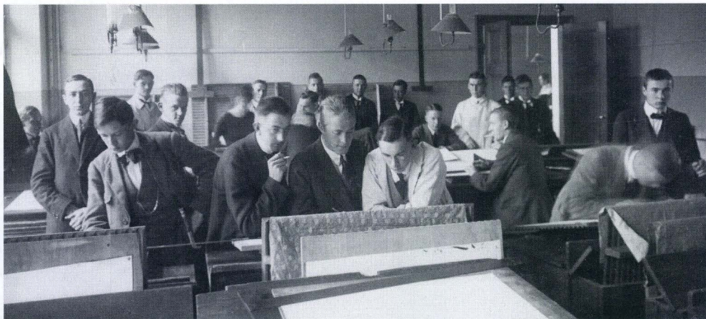
Kuva piirustussalista vuodelta 1918.

sä tasan ratkaisi puheenjohtaja asian anomusehdotuksen hyväksi, jolloin vastustajat liittivät pöytäkirjaan vastalauseensa ja valittivat Opettajakollegiin asiasta. Laadittuaan ja saatuaan yhdistyksen lausunnon opettajakollegi teki päätöksensä vasta helmikuulla 1913, hyljäten valituksen.