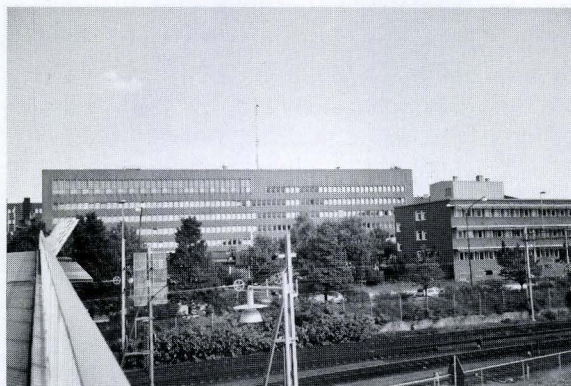
Söderin kaupunginosa ja poliisitalon valvova silmä satama-alueelle.

Kirjoittaja on kansatieteen jatko-opiskelija. terhi.torkki@helsinki.fi