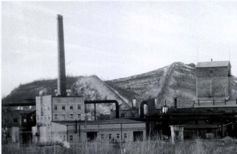
Palavan kiven jalostuksessa syntyy valtavia jätevuoria.

Keväällä 2002 Kohtla-Nõmmessa avattu kaivosmuseo ( http://kohtla-nommevv.ee/ museum ) antaa konkreettisen kuvan kai- vosmiesten työstä. Ennen maan alle astumista vieraat pukeutuvat kaivosmiesten käyttä- miin takkeihin. Astellessaan samoja kuraisia