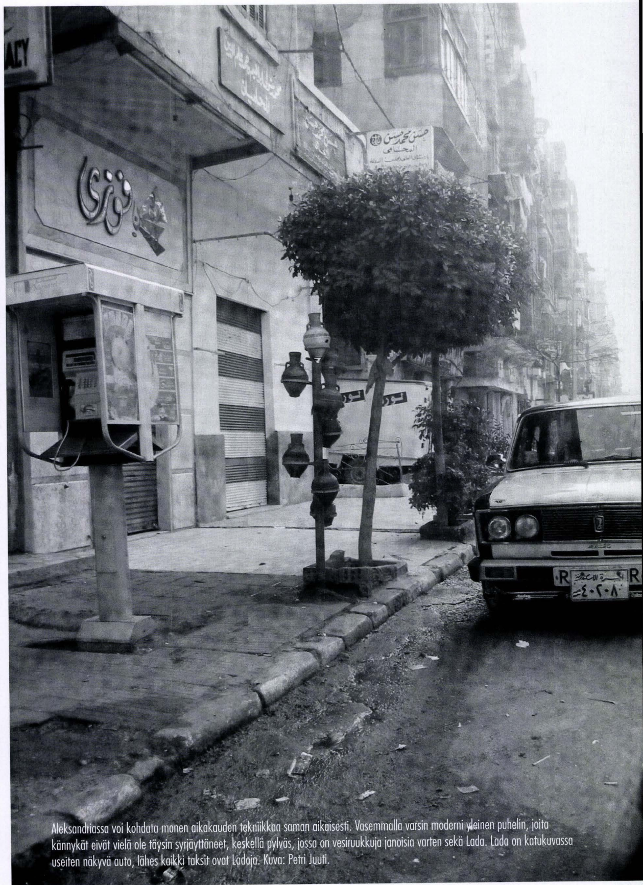
Aleksandriassa voi kohdata monen aikakauden tekniikkaa saman aikaisesti. Vasemmalla varsin moderni yleinen puhelin, joita kännykät eivät vielä ole täysin syrjäyttäneet, keskellä pylväs, jossa on vesiruukkuja janoisia varten sekä Lada. Lada on katukuvassa useiten näkyvä auto, lähes kaikki taksit ovat Ladoja.