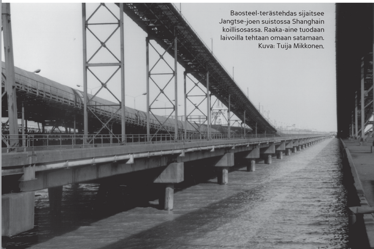
Baosteel-terästehdas sijaitsee Jangtse-joen suistossa Shanghain koillisosassa. Raaka-aine tuodaan laivoilla tehtaan omaan satamaan.

Yhtiön tunnus on ”Green Baosteel”, sillä keskeinen osa yrityspolitiikkaa on luonnon huomioon ottaminen. Tehdasalue kattaa huikat 19 neliökilometriä. Kokonaispinta-alasta 43 % on luonnonvaraista metsää ja viheraluetta. Tämän lisäksi tuotantoalueella on eläintarhakin. Yhtiön tavoitteena on vih-