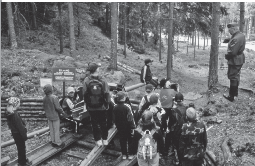
Koululaisryhmä saa opastusta kunnostetussa panssarintorjuntatykin avoasemassa Miehikkälän Salpalinjamuseon alueella.

ja-museo, Virolahden kunnan hallinnoima Bunkkerimuseo, Salpalinjan perinneyhdistys (ry) ja Pioneeriaselajin Liitto ry:n hallinnoima Pioneerimuseo. Suunnitteluhanke työsti vuonna 2002 kaikille osatoimijoilleen kehittämissuunnitelmat, ja niiden pohjalta rakennettiin yhteinen Salpakeskus-hanke. Rahoitusneuvotteluiden jälkeen tämä kattohanke jaettiin kahteen erilliseen etenemislinjaan. Yhtäältä lähdettiin tuottamaan museo- ja toimijakohtaisissa hankkeissa Salpakeskukseen liittyviä sisältöjä, ja toisaalta taas päätettiin viedä Salpakeskuksen rakennusinvestointia omana kokonaisuutenaan eteenpäin.