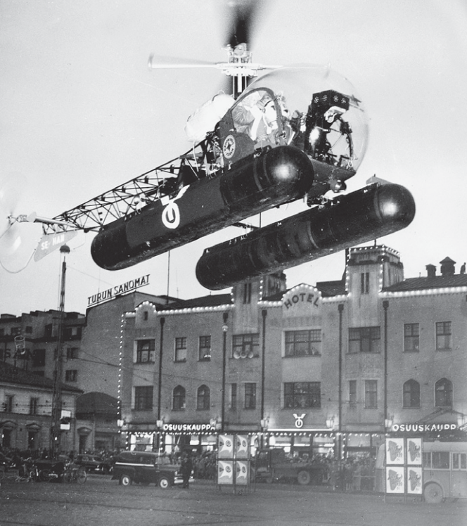
Joulupukki laskeutumassa Turun kauppatorille ruotsalaisella helikopterilla 1957.

kastaa lainaamalla autoa tai ahtautumalla jouluruuhkaisen junan tungokseen, yksi laite tepsii. Suomalaisen sanojen mukaan naapurin pieni Ville saa nimittäin laulussa aatteen, että pukki voisi ostaa helikopterin Korvatunturille. Lentolaite ei ole riippuvainen lumesta. Porotkin joutaisivat pulkan edestä pois. 20