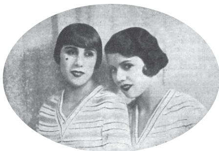
Naisen aseman vapautumisen symbolina toiminut lyhyt hiusmuoti yleistyi Suomessa 1920-luvun jälkipuolella. Kähertäjä 2-3/1928, 1.

Aina 1920-luvulle asti saatavilla oli vielä melko suppea valikoima kampaajan työvälineitä sekä hiusten hoitoon, värjäykseen ja muotoiluun käytettäviä valmisteita. 6 Kampaamoissa käytettävien laitteiden ja muiden työvälineiden kulutus oli vielä pitkälti ulkomaantuonnin varassa, mutta kotimainen tekniikan teollisuus kykeni jo tyydyttämään osan hiustenhoitotuotteiden kysynnästä. Esimerkiksi ennen ensimmäistä maailmansotaa Suomessa toimi kuusitoista saippuutehdasta, joista osa valmisti hiusvesiä ja -öljyjä sekä hiussaippuota eli shampoita. 7 Hiustenkuivaajia oli valmistettu vuosisadan alusta lähtien, mutta vielä 1920-luvulla ne olivat kalliita, heikkotehoisia ja huonosti ammattikäyttöön soveltuvia. 8