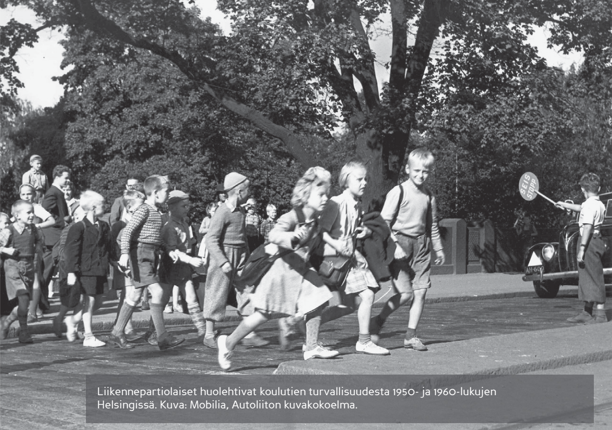
Liikennepartiolaiset huolehtivat koulutien turvallisuudesta 1950- ja 1960-lukujen Helsingissä.

erityisteemoja ovat: Koululaitoksen historia (koulu, koti, oppimisvälineet), koululaisten liikennekasvatus, koulukyydit ja koulukyytien merkitys taksi- ja linja-autoliikenteelle sekä koulumatkamuistot.