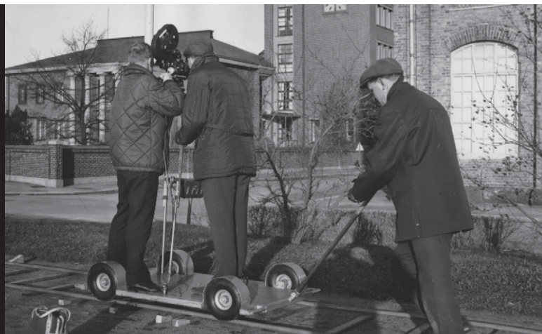
Vuonna 1964 Porissa dokumentoitiin puuvillatyttöjen arkea.

Yksi historiakulttuurin käytänteistä on vaikeina aikoina tulkita jokin mennyt ajanjakso kulta-ajaksi, johon nykyisyyttä verrataan. Porin Puuvillatehtaan kulta-ajaksi keksittiin 1970-luvun lopulla ”Ekin aika”. Johan Hen-