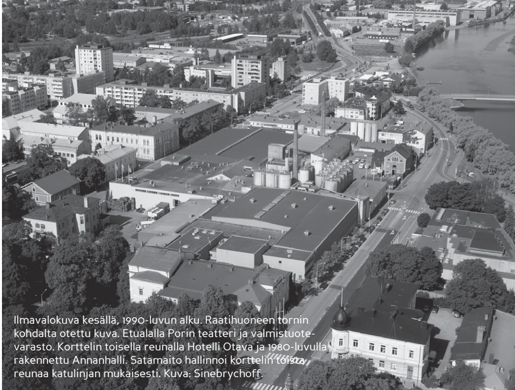
Ilmavalokuva kesällä, 1990-luvun alku. Raatihuoneen tornin kohdalla otettu kuva. Etualalla Porin teatteri ja valmistusvarasto. Korttelin toisella reunalla Hotelli Otava ja 1980-luvulla rakennettu Annanhalli. Satamaito hallinnoi korttelin toista reunaa katulinjan mukaisesti.

totoimintaan suunniteltua arkkitehtuuria, joukossa kuitenkin useita inventoinnissa mainittuja ja Satakunnan Museon suojeltavaksi esittämiä rakennuksia. Sisätiloiltaan rakennukset ovat alkuperäisestä käyttötarkoituksestaan riisuttuja, eivätkä siten teollisuusmuseoinnin kannalta enää panimoteollisuuden koneistusta ja prosessia kuvaavia.