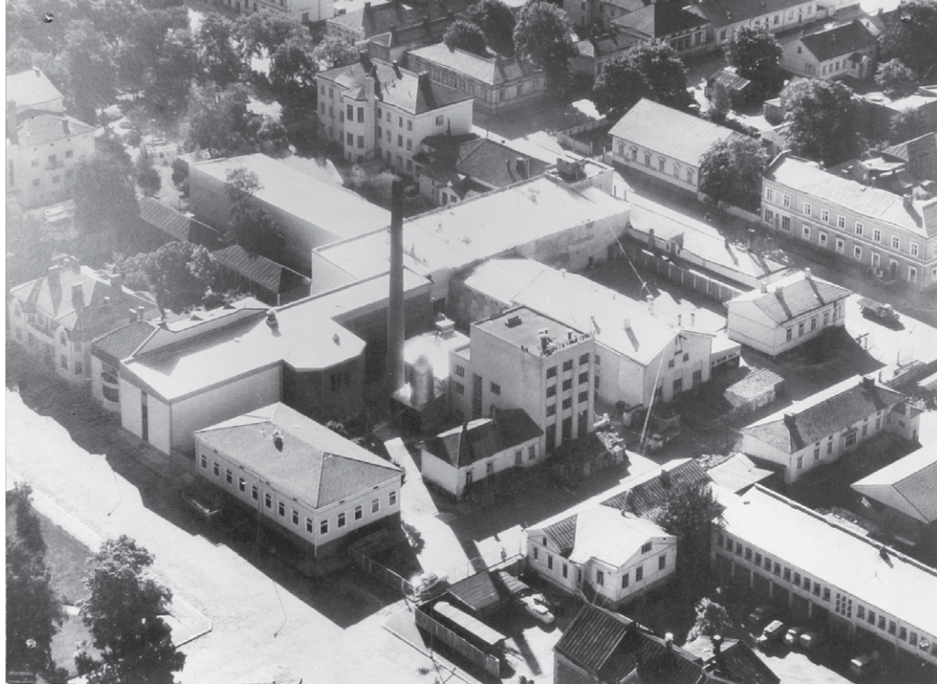
Vuonna 1972 otetussa kuvassa Annankatu on katuoson molemmista päistä suljettu verkkoaidalla, mutta näkymä on vielä avoin. Keskellä vasemmalla Nybergin talo, korttelin vastakkaisella puolella kolmikerroksinen Hotelli Otava. Kortteli on muodostunut eri-ikäisistä rakennuksista ja sen yleisilme on avoin ja sopusuhtainen.

gin johtoportaan mielestä mahdollista. Asemakaavamääräys koski vain hotellirakennusta. Hotelli Otavan kanssa samanaikaisesti 1850-luvulla rakennettu Ravintola Otava sekä jugendtyylinen, rakennukset toisiinsa yhdistävä lisärakennus purettiin vuonna 1985 oluttehtaan liikenteellisten tarpeiden alla. 14 Hotelli Otavan asema Raatihuoneen puiston reunalla oli kaupungin päättäjien arvostuksessa korkeimmalla, eikä sen korvautumista panimoteollisuudella voitu edes harkita.