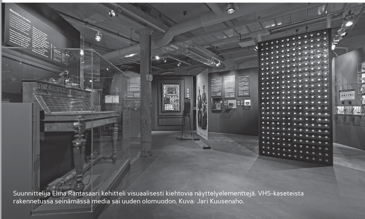
Suunnittelija Elina Rantasaari kehitteli visuaalisesti kiehtovia näyttelyelementtejä. VHS-kaseteista rakennetussa seinämässä media sai uuden olomuodon.

Monia pirkanmaalaisia mediatekniikan parissa työskennelleitä edelläkävijöitä mää-