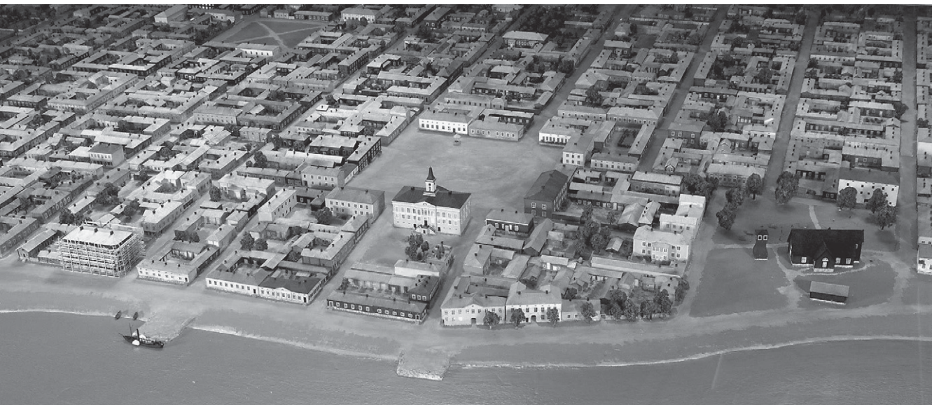
Porin kaupunki ennen vuoden 1852 paloa.

joitakin kompromisseja onkin täytynyt tehdä ristiriitaisten tietojen välillä.” 21