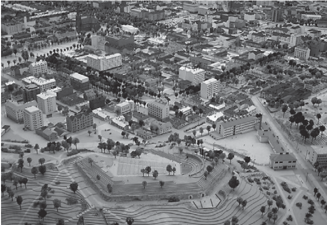
Viipurin pienoismalli. [ http://www.joet.info/karjalan_kannas.html ] Haettu 18.4.2013