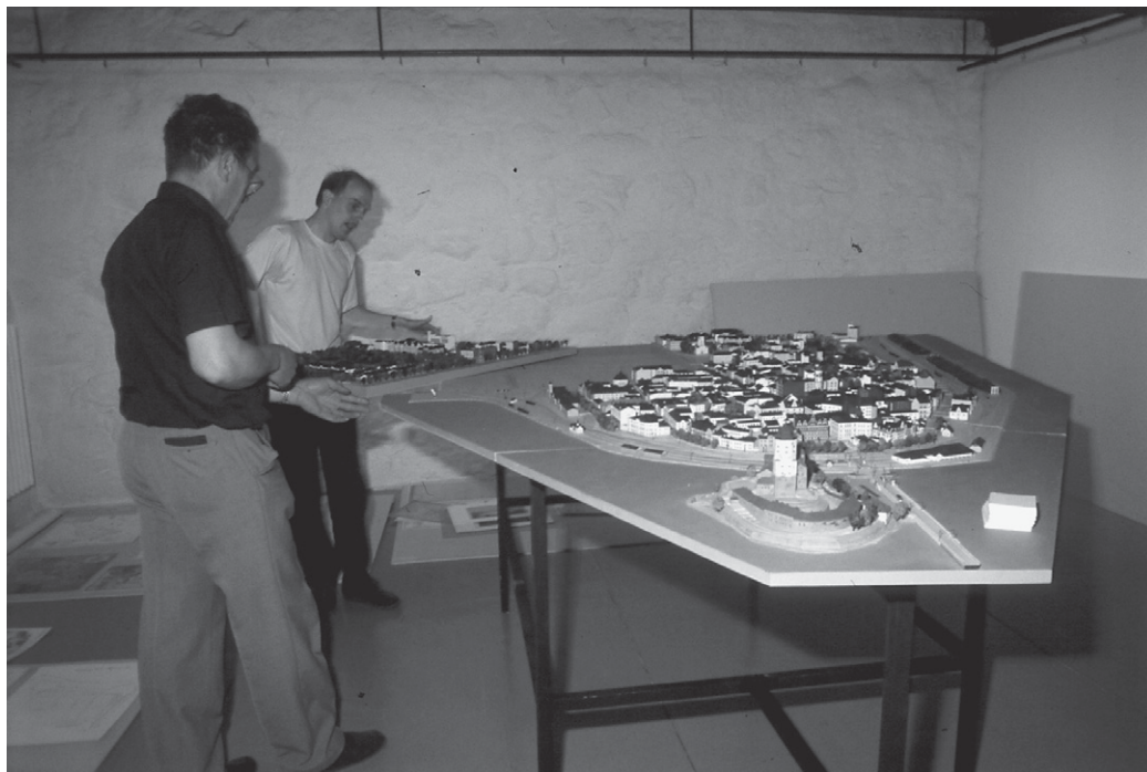
Viipurin pienoismallin ensimmäisen osan kokoaminen esille museon pieneen huoneeseen. Aluksi se oli esillä ilman minkäänlaista vitriiniä suojanaan, vain naruilla aidattuna.

harmaakivimakasiineissa. 67 Lappeenrannan kaupunginhallitus päätti vuonna 1976 varata tilat valtakunnallisen Wiipuri-museon keräyksen esineistön tallettamiseen. Lisäksi sovittiin erikseen myöhemmin päätettävänä ajankohtana järjestää Etelä-Karjalan museon yhteyteen ja hallinnon alaisuuteen Wiipuri-museon osasto. 68 Säätiö oli sopinut Lappeenrannan kaupungin kanssa esineistön sijoituksesta Etelä-Karjalan museoon, mutta pienoismallin sijoitus ei kuulunut tähän sopimukseen. Pienoismallista olivat kiinnostuneet Lappeenrannan lisäksi Lahti ja Helsinki. 69