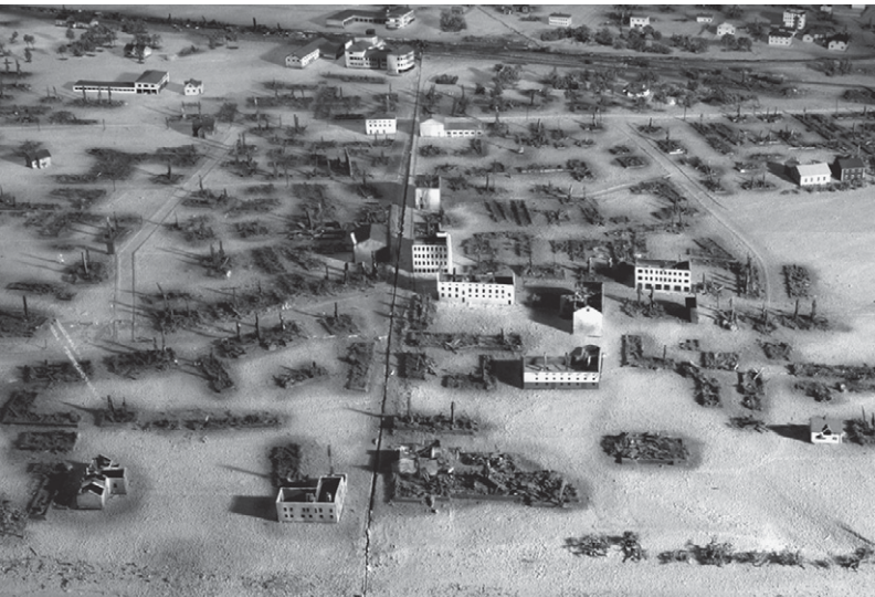
Yksityiskohta vuoden 1944 Rovaniemen kauppalan kaupunkipienoismallista. Valmiit pienoismallit ovat kooltaan 3,5 x 4 metriä. Mittakaava 1:500.

Pienoismallien toteutuksen mittakaava on 1:500, ja ne teetettiin alueelta, johon kuului nykyinen ydinkeskus, osa III-kaupunginosaa sekä rautatien eteläpuolta Harjulampeen asti. Mainituilla alueilla oli 1930-luvulla noin 530 asuinrakennusta ja noin 800 muuta rakennusta. Pienoismalleissa piti pyrkiä toteuttamaan vallinneet tilanteet mahdollisimman aitoina. 34 Pie-