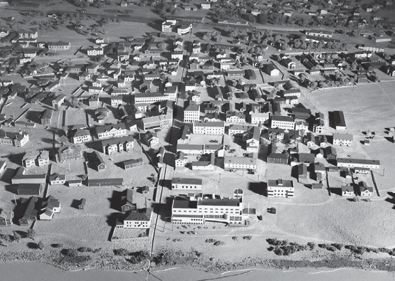
Yksityiskohta Rovaniemen kauppalan kaupunkipienoismallista, joka esittää vuotta 1939. Rovaniemen kauppalassa oli tuolloin 530 asuin- ja 800 muuta rakennusta. Mittakaava 1:500.