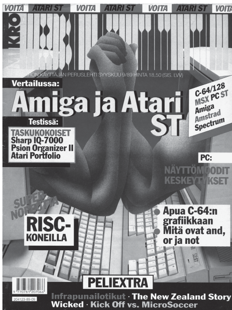
Kuva 2. MikroBitin syyskuun 1989 kansi kuvasi osuvasti Amigan ja Atari ST:n käyttäjien välistä "kädenvääntöä".

Toinen konesotien aalto syntyi 1980-luvun lopulla, kun uudet 16-bittiset kotitietokoneet tulivat markkinoille. Commodore 64:n seuraajaksi tulleen Amiga 500:n tärkeimmäksi kilpailijaksi muodostui Atari ST. Tutkimukset viittaavat siihen, että tuohon aikaan Atari ST:n julkisuuskuva oli varsin myönteinen Euroopassa, ja Suomessakin esimerkiksi tietokonelehdistö uskoi mallin pärjäävän hyvin kilpailussa, kuten kuvan 2 tasaväkisessä kädenväännössä. Toimittajien