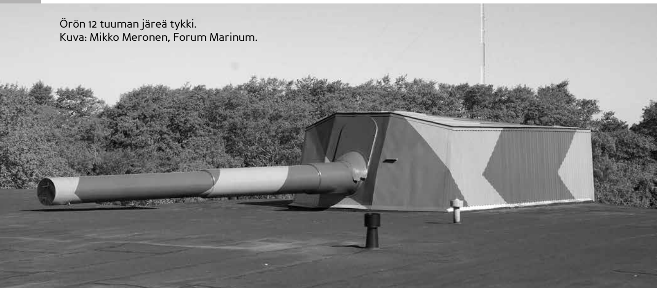
Örön 12 tuuman järeä tykki.