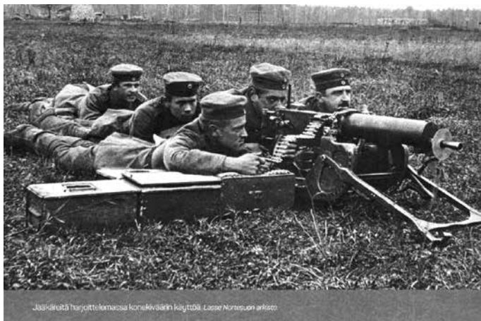
Jääkäreitä harjoittelemassa konekiväärin käyttöä.

Itsenäistymisemme vaiheisiin pereh-tyneen FT Tuomas Hopun kirjoittama, paljolti tuoreen lähdemateriaalin varaan rakentuva teos kertoo jääkäreiden tarinaa kir-jeiden ja päiväkirjojen valossa.