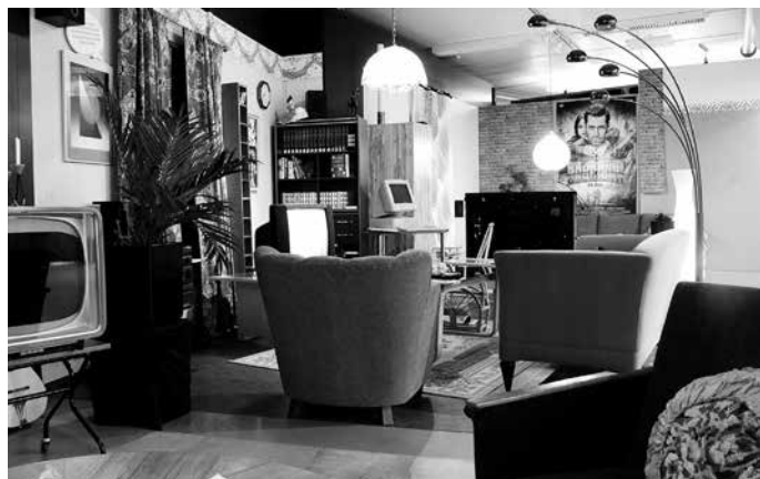
Miljööt viestintäteknologianäyttelyssä kutsuvat sohvalle istumaan.

puolet maailman väestöstä pystyy käyttämään Internetiä. Joillekin virtuaalisuus, verkottuminen ja mobiili elämäntapa ovat edelleen unelmia.