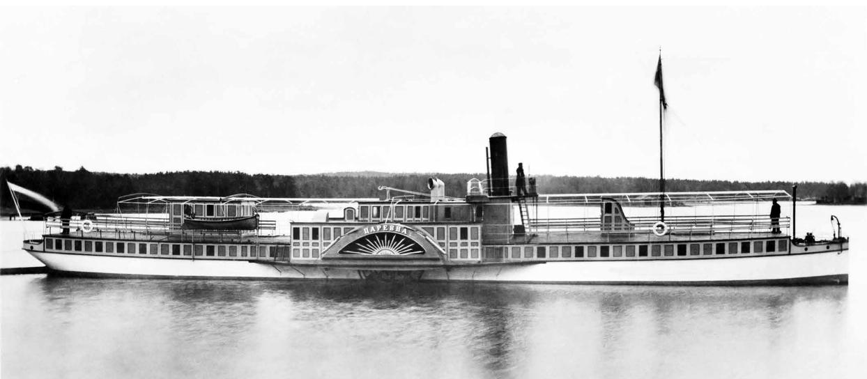
Matkustaja-hinaaja, siipirasalus Zarewna (rak. nro 194) valmistui vuonna 1894.

että asiakkaan on ollut mahdotonta tietää, missä organisaatiossa toivottu materiaali sijaitsee. Palvelun myötä mahdollistuu koko aineiston tarkastelu yhtenäisenä, paikasta ja ajasta riippumatta.