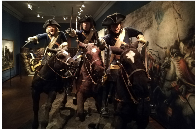
...mutta vanhaa sodankäyntiä tapahtumia ja käyttöä korostaen.

Armémuseum jättää kävijälle monia kysymyksiä sodasta, rauhasta, kansakunnasta ja ihmiselämästä. Vastauksia ei kannata odottaa kaikkiin vakavaa aihetta koskeviin kysymyksiin. Uusimmissa näyttelyissään museo onnistuu erinomaisesti purkamaan vaikeita ilmiöitä sekä älyllisesti että tunteellisesti. Samalla uusimmat näyttelyt asettavat vanhemmat osiot kiittämättömään asemaan. Sodan esittämisen tavat ovat muutoksessa, minkä takia toivonkin, että sotamuseot saisivat tarvitsemansa resurssit näyttelyidensä uudistamiseen. Pelkkä mykkä rauta hämärässä makasiinissa ei enää riitä avaamaan sodan historiaa.