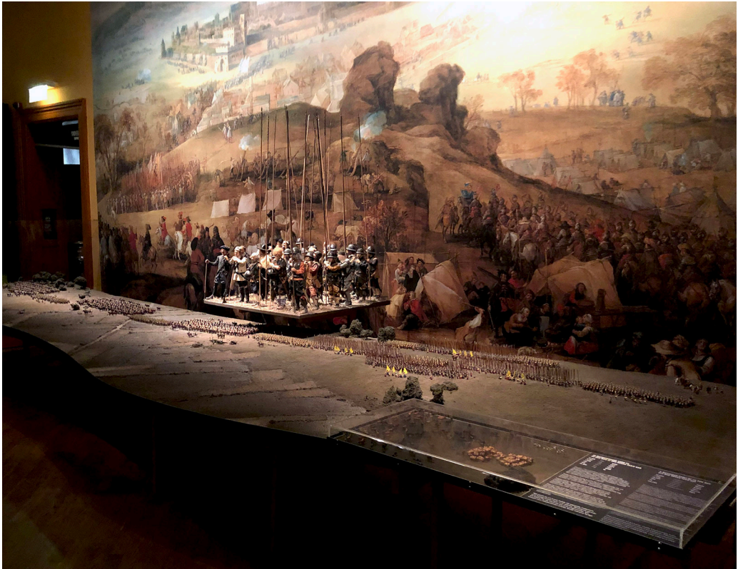
Kuva 5. Armémuseumin näyttelyiden suuret dioraamat ja pienoismallit täydentävät uusia digitaalisia taisteluesityksiä. Niiden avulla historiallisten armeijoiden mittakaava avautuu yhä oivallisesti, vaikka liike puuttuukin.

Yhteiskunnan suhde sotaan on näyttelyssä paitsi sosiaalinen myös tekninen. Näyttely avautuu väkivallan ajattomuuden pohdinnalla ihmisen esivanhemmista mannertenvälisiin ydinohjuksiin. Korkealentoisen aloituksen jälkeen näyttely asettuu perinteiseen kronologiseen kerrontaan, jossa Ruotsin valtakunnan historian eri sotia peilataan aikakauden sosiaalisiin teemoihin yhteiskuntaluokkien välisistä suhteista infrastruktuurin kehitykseen ja teollisuuden ja talouden kysymyksiin. Näytteillä olevat esineet kertovat museon kokoelmien historiasta; aseet ja haarniskat saavat etusijan vanhempien aikojen esittelyssä. Puutteita on täydennetty näyttävin, suorastaan suurellisin kuvaelmin. Välillä uusi digitaalinen teknologia pilkistää tämän selvästi aikaansa jääneen tyylin lomasta. Museon henkilökunta tunnistaakin vanhentuvan näyttelyn ongelmat. Yksittäisiä osioita on uudistettu ja uudistuksia on tarkoitus jatkaa vastedeskin. Suuri tarina Kustaa Vaasan vallankumouksesta Suomen sotaan muodostaa silti tarinan punaisen langan.