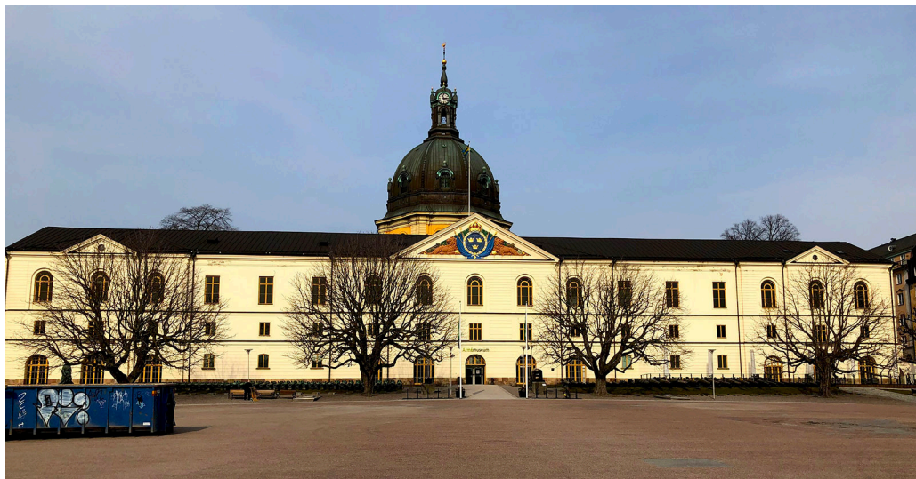
Kuva 1. Yli-intendentti Carl Johan Cronstedtin ja eversti Carl Ehrensvärdin 1760-luvulla suunnittelema Armémuseum kylpee keväturingossa Tukholman Österlalmilla.

Sodankäynnin esineellistä kulttuuriperintöä on tyypillisesti säilynyt valtiollisissa kokoelmissa, joten sotamuseoiden historia on jo tästä syystä kansallista historiaa. Armémuseumin kokoelmissa pelkästään esineitä on keskiajalta nykypäivään yli 100 000 pienistä arkeologisista fragmenteista kokonaisiin kylmän sodan aikaisiin asejärjestelmiin. Kokoelmien painopiste on ymmärrettävästi Ruotsin hetkittäin hyvinkin sotaisassa historiassa, minkä takia eri osapuolten tasapainoinen käsittely edellyttää tarkkaa näkökulmien valintaa. Sodan jalkoihin jääneiden siviilien kohtalot ja sodan muistamisen erilaiset tavat on nostettu uuden sotahistorian tutkimuksen myötä tarkastelun keskiöön. Samalla näyttelyt ovat alkaneet avautua aiempaa monipuolisemmille tarinoille. Erinomaisen esimerkin tästä tarjoaa Armémuseumin uusien näyttely.