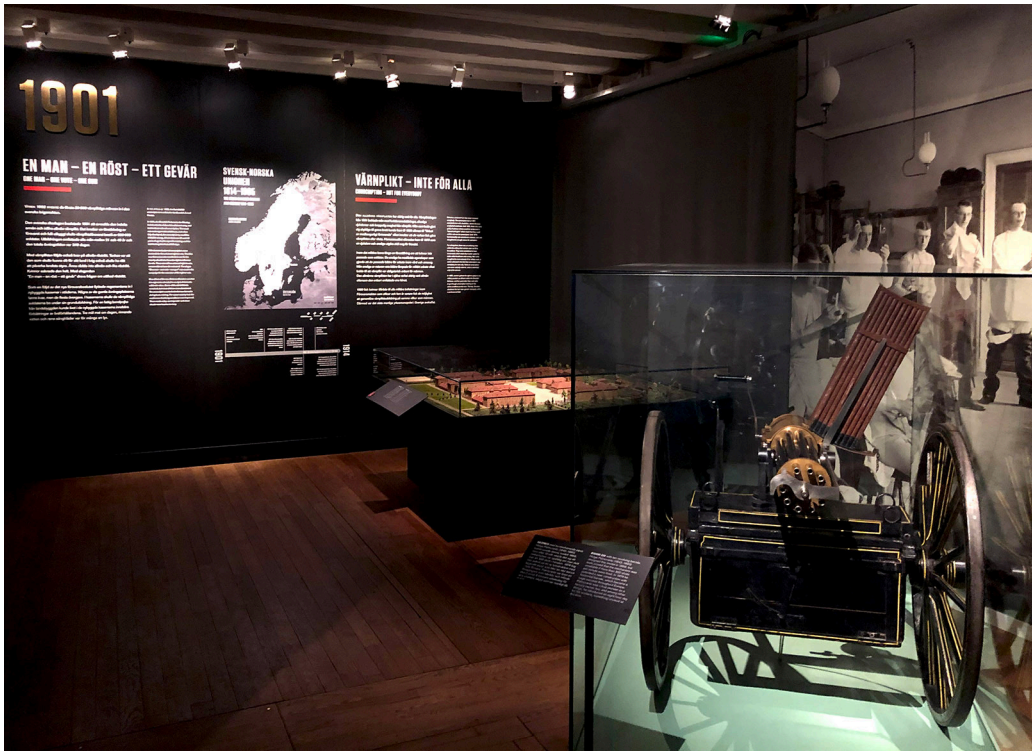
Kuva 6. 1900-lukua käsittelevässä näyttelyosiossa teknologinen kehitys nousee pakostakin tarinan keskiöön. Taistelukuvausten sijaan se esitetään kasarmin ja globaalin turvallisuuden kontekstissa.

tuksetta esille sotamuseoille ongelmallisen aiheen, rauhan. Mitä käsitellään, kun ei käsitellä sotaa? Näyttelytekstien yleiset tarinat peilaavat historian tutkimusta, mutta esineiden kautta avautuu näkökulma tehostuvan ja teknistyvän tuhon maailmasta.