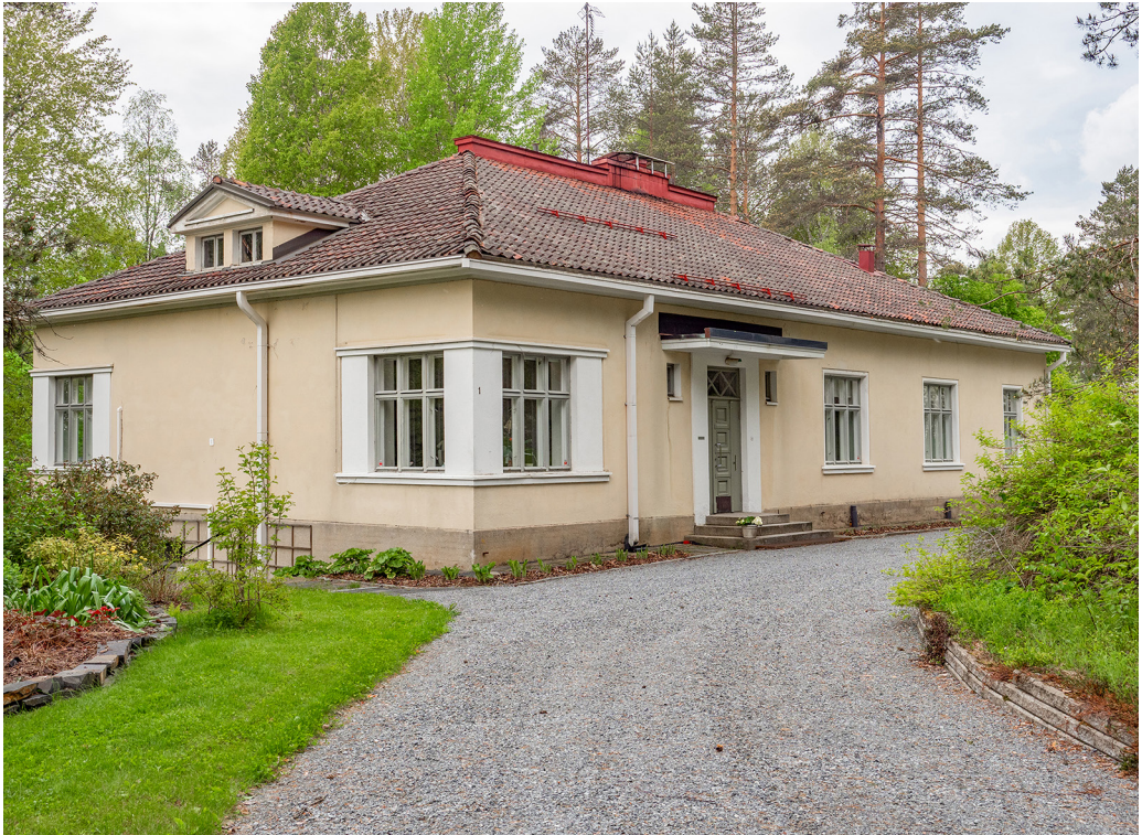
Kuva 3. Virkailijakunnalle ja työnjohdolle suunnitellulla Raivionmäen alueella sijaitsee niin kutsuttu Alatalo. Siitä muodostui noin neljän vuosikymmenen ajaksi kaivoksenjohtajien asuintalo. Alatalon suunnitteli arkkitehti Wäinö Gustaf Palmqvist ja rakennus valmistui vuonna 1938.

Etelä-Suomessa asuneiden arkkitehtien lisäksi kaivosyhdyskuntaa suunnittelivat kaivosyhtiöiden omat rakennusmestarit ja myöhemmin myös joensuulaiset yksityissektorin arkkitehdit. Jälkimmäiset olivat mukana kahdessa modernistisin periaattein toteutetussa asuinalueessa, Pohjoisahossa ja Kaasilassa. Pohjoisahon kerros- ja rivitaloalue valmistui 1960-luvun aikana ja sen suunnitteluun sovellettiin metsälähiöperiaatteita. Pääasiassa 1970-luvulla toteutettu Kaasila suunniteltiin kompaktikaupunki-ideologian periaatteiden mukaan säännölliseen uusruutukaavaan, tai oikeastaan sen paikalliseen tulkintaan nojaten. 7