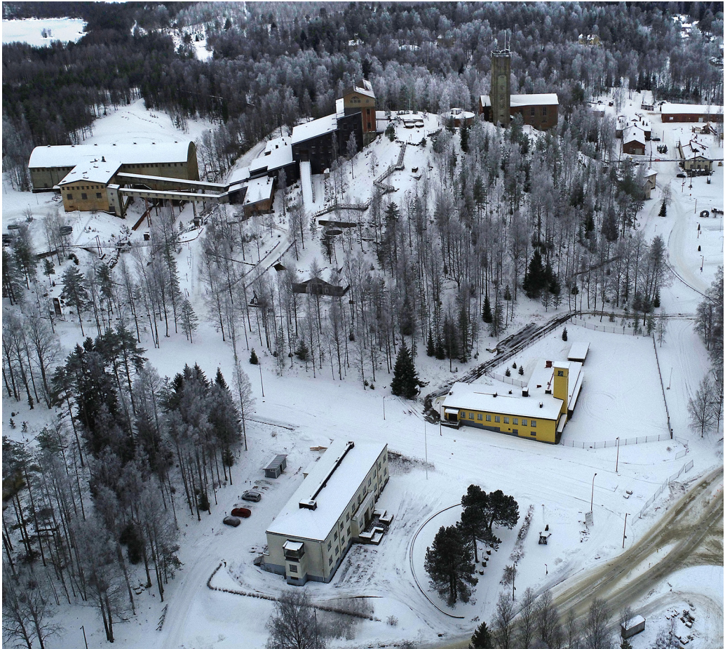
Kuva 1. Outokummun taajamakuva on hallinnut 1920-luvun lopusta lähtien Vanhan kaivoksen torni ja rikastustehdas. Etualalla näkyvällä Alatorin alueella hahmottuvat ennen kaikkea valkoinen Outokumpu-yhtiön entinen pääkonttorirakennus (1937) ja keltainen kaivoksen entinen paloasema (1937).

Kaivostoimintaa harjoittaneiden yhtiöiden halu tilata suunnittelutöitä arkkitehdeiltä liittyy osittain siihen, että asuinolosuhteita pyrittiin pitämään kohtalaisen laadukkaina. Varsinkin virkailijakuntaa ja työnjohtajia pyrittiin houkuttelemaan Outokummun kaivokselle asuntoedulla. 4 Esimerkiksi 1940–1960-luvuilla näille työntekijäryhmille arkkitehdit suunnittelivat moderneja asuntoja, jotka pitivät sisällään aikakautensa halutut käyttömukavuudet.