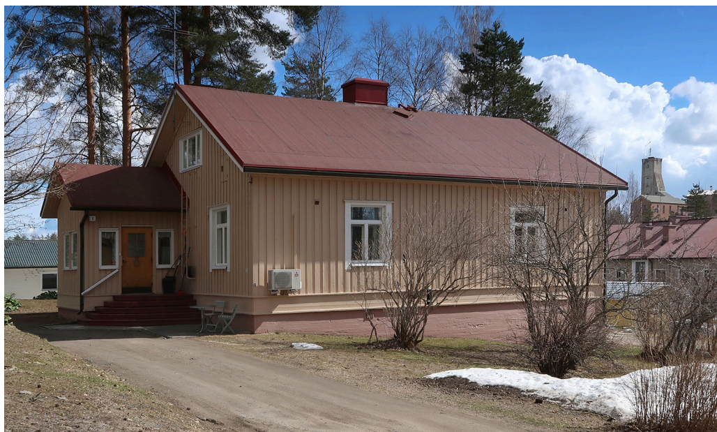
Kuva 4. Kyykerin asuinalueelle valmistui 1930-luvun jälkipuoliskolla 37 tyyppipiirustusten mukaan suunniteltua kahden perheen taloa. Tähän päivään taloista on säilynyt 24.

1970- ja 1980-luvuilla teollisuusyhtiöiden asuntopolitiikka muuttui edelleen. Esimerkiksi Outokumpu Oy katsoi, että sen voimavarat eivät riittäneet enää aikaisemmin noudatettuun asuntoasioiden järjestämiseen ja tämä tehtävä nähtiin kuntien ja valtion toimenkuvaan kuuluvaksi. 9