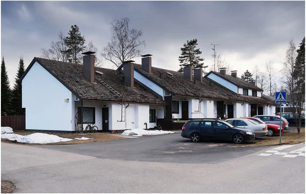
Kuva 2. Rivitalo osoitteessa Kyykerinkatu 3 on esimerkki 1950-luvulla virkailijakunnalle ja työnjohdolle suunnatusta modernista asuntotuotannosta. Kyykerin asuinalueelle vuonna 1957 valmistuneen rakennuksen suunnitteli Arkkitehtitoimisto Blomstedt & Lampén.