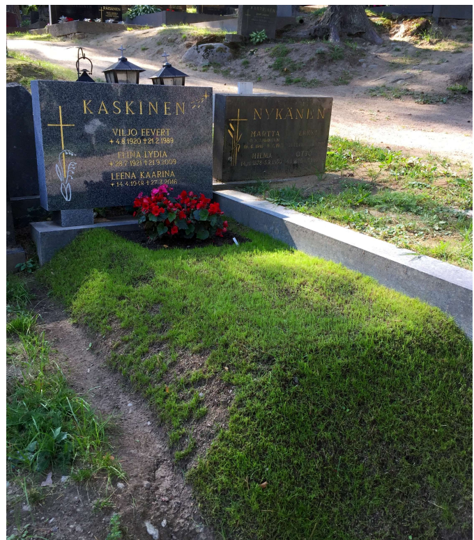
Kuva 1. Viimeinen leposija kuin seinän viereen sijattu vuode.

tuoksut ovat läheisessä yhteydessä tunteisiin sekä muistiin. (Ks. esim. Tuominen 2012, 12–16.) Hajut eivät kuitenkaan ole vain aistimuksia, vaan niihin liittyy tulkinta, jokin aistimuksen ylittävä merkityssisältö. Näihin hajujen ja tuoksujen merkityksiin kohdistuu tarkasteluni hautausmaan erityisessä ympäristössä. Tutkimisentapaani voi kutsua deskriptiiviseksi ympäristöestetiikaksi, jossa omakohtaiset ympäristökokemukset ja niiden analysointi yhdistyvät tieteellisiin ja taiteellisiin lähdeaineistoihin. Pohdin, millaiset ajatukset ja tulkinnat muovaavat hautausmaiden haju- ja tuoksu-ympäristön kokemusta. Teen ekskursioiden paikan päälle eräälle hautausmaalle, Savonlinnan Talvisaloon, missä toiset odotukset vahvistuvat ja toiset kumoutuvat. Pohdin myös sitä, mitä hajuaistin todistus kertoo suhteestamme kuolemaan tuolla maallisella loppusijoituspaikallamme.