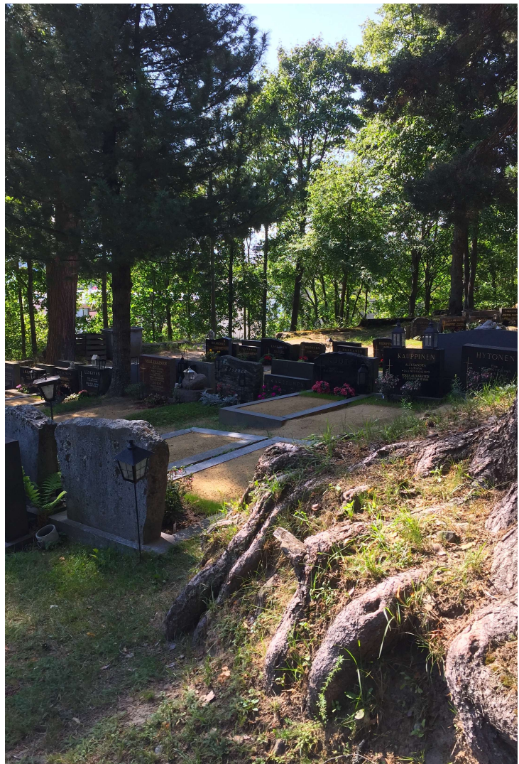
Kuva 5. Mänty varjelee hautausmaan rauhaa karuissakin kasvuoloissa.

Mänty on yksi yleisimmistä hautausmaiden puulajeista. Ei mikä tahansa puu kestä männyn vertaa sitä, että sen juurilla kaivellaan ja maata täytetään uudelleen. Männyn paalujuuri auttaa sitä pysymään elossa ja pystyssä melko vaatimattomissa kasvuoloissa. (Kankainen 2010, 3.) Männyt ovat ikuisen elämän vertauskuvia ja siksi niitä on istutettu hautausmaille. Erityisesti vanhoja puita on arvostettu tässä merkityksessä. (Biederman 1989/1993, 234.) Kuoleman rituaaleihin mänty liittyy myös perinteisenä karsikkopuuna, eli vainajalle omistettuna karsittuna puuna. Kehdosta hautaan, tässä siis hauta-arkkuun, on mänty ollut suomalaisen seurana. (Ks. http://www.taivaannaula.org/2012/08/06/puiden-juurilla/ )