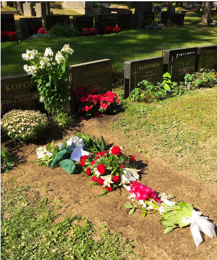
Kuva 6. Hauta on luotu umpeen ja hyönteiset pörräävät kuihtuvissa muistokukissa. Ruumiin matka osaksi luonnon kiertokulkua voi alkaa.

Hautausmaalla ei kuitenkaan käydä vain hautajaisissa. Kesän kukkien istutus ajoittuu ilman lämpenemisen puolesta vilkkaisiin alkukesän päiviin. Hautausmaalla saattaa nähdä tuttajakin omien omaistensa hautoja laittamassa. Siinä voi jutella kuulumiset, muistella edellisen viikon teatteriretkeä ja valittaa, kuinka hankala on saada lopetettua lehden tilaus. Haudan hoitamisesta tulee käytännöllistä puutarhatyötä. Ei elämästä erillistä vaan siihen kuuluvaa.