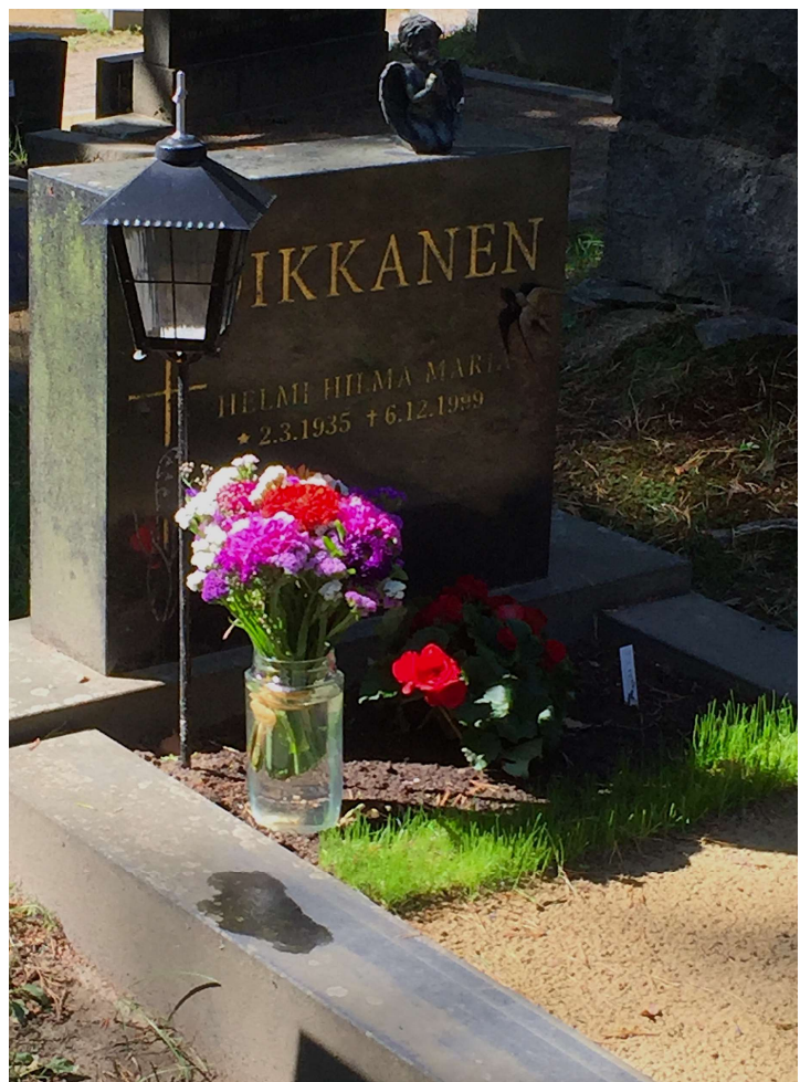
Kuva 7. Leikkokukkien hetkellinen kauneus.

Mikrotason hajuympäristöt muuttuvat sitten jopa haudalta toiselle: tuossa on sitä hajutonta begoniaa, mutta myös puhdasta hiekkaa, tässä puolestaan jotain pienilehtistä, vihreää katekasvia, joka suikertaa jo reunakivien ylikin ja orvokkejakin on alkukesästä ollut. Vain petuniaa istuttava haistaa sen lehtien omituisen virtsamaisen hajun, kun niitä hieraisee: läheltä ja siinä hetkessä. Joskus haudoille tuodaan tuoksuvia leikkokukkia. Kartiollinen kieloja tuoksuu hetken huumaavalle, mutta pian seisova vesi lakastuvien kukkien alla alkaa haista karmealle. Ajalliset vaihtelut hajujen ja tuoksujen kohdalla ovat vähintään yhtä moninaiset kuin tilalliset.