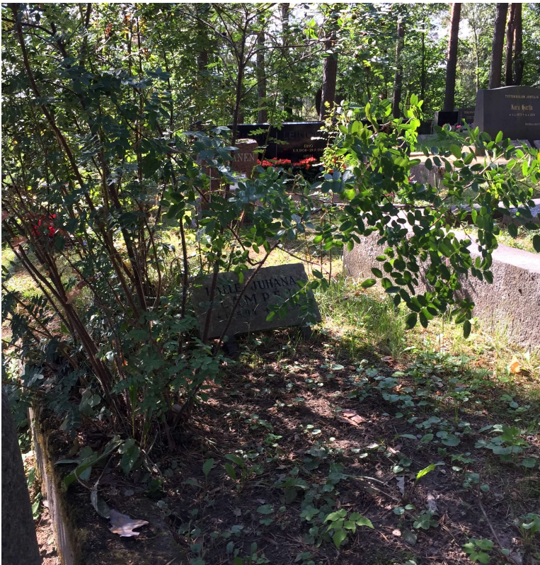
Kuva 4. Ruusupensaalla muistettu – ja sen alle unohdettu.

aiheuttaisi allergisia oireita (Salminen 2014). Pensaissa kuitenkin olisi paljon nenän korkeudella tuoksuvia: syreeneitä, jasmiineja, ruusupensaita, angervoja, mutta yleensä puita ja pensaita ei korkeutensa puolesta saa hautapaikalle istuttaa. Jonkin verran niitäkin hautausmailta löytyy joko suunnitellusti seurakunnan toimesta tai kansalaistottelemattomien omaisten istuttamina.