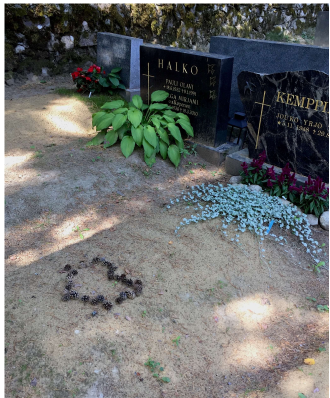
Kuva 9. Kävyntuoksuiset terveiset Joukolle on lähetetty ennen edellistä sadetta.

Eräälle hiekkahaudalle on aseteltu männynkävyistä sydänkuvio. Sade on heilauttanut yhden kävyn paikoiltaan. Kumarrun korjaamaan sen. En edes yritä haistaa käpyä. Kävyn tuntu sormissa riittää tuomaan mieleeni tutun tuoksun. Kuivat ja lämpimät, rosoiset kävyt ja vaalea hiekka kuljettavat ajatukseni äitini kotipaikalle. Tunnen niiden tuoksun, vaikka en niitä varsinaisesti nyt haista. Ei tämä 45-vuotiaana kuollut Jouko, jolle sydän on tehty, ole minun tuttujani. Mutta mieleeni tulee nuorena miehenä kuollut enoni. Muuta en hänestä oikein muista kuin sen,