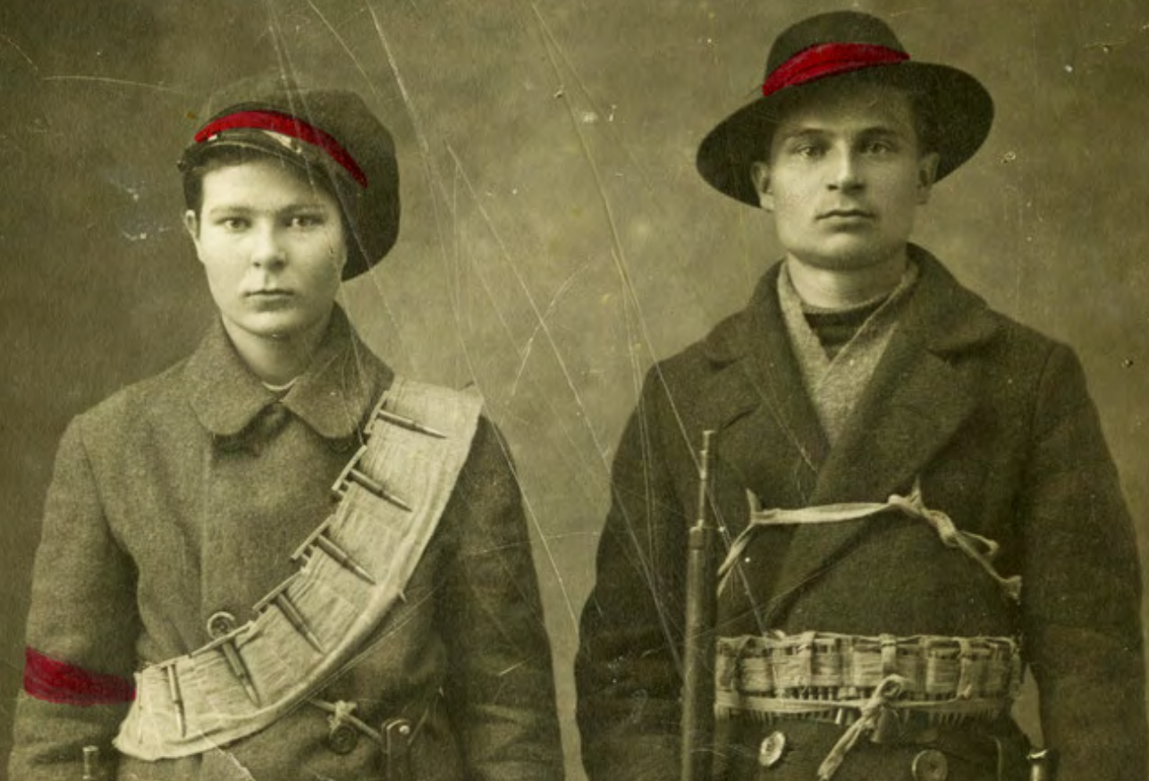
Tuntemattomat punakaartilaiset poseeraavat valokuvaamossa Viipurissa vuonna 1918.

Viipurin Papulassa sijaitsi joukkohauta, jonne haudattiin sisällissodan aikana teloitettuja punaisia. Vainajia kuitenkin siirrettiin heti sodan jälkeen vuonna 1918. Tutkimuskirjallisuudessa on esiintynyt virheellistä tietoa siitä, minne hauta siirrettiin ja liittyikö siihen vainajien tarkoituksellista häpäisemistä. Virheellisiä käsityksiä on syytä oikaista.