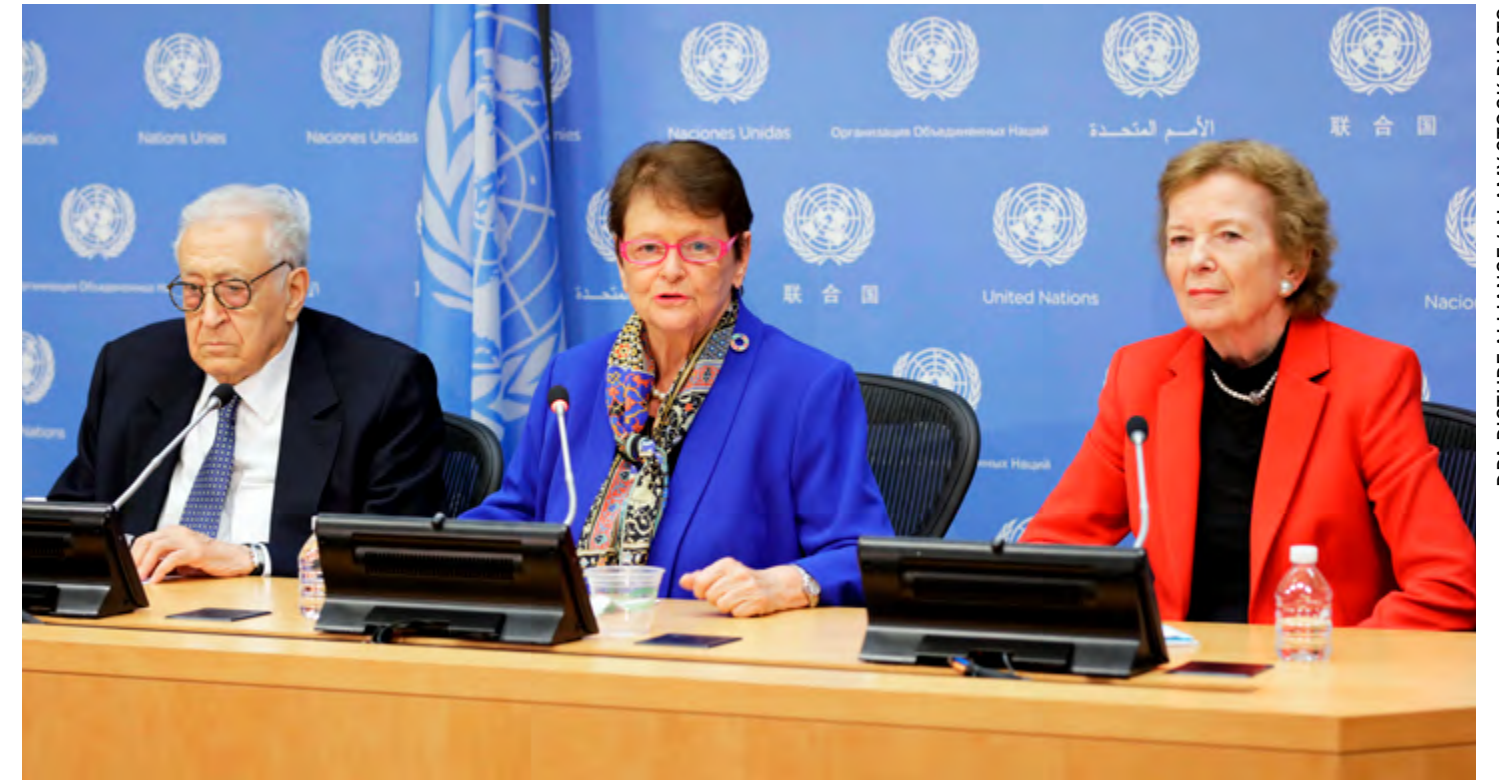
Gro Harlem Brundtland on viime vuosina vaikuttanut esimerkiksi YK:n The Elders -ryhmässä, joka kokoaa entisiä valtionpäämiehiä edistämään rauhan asiaa.

Toinen vaihtoehto olisi nimetä yksi avainulottuvuus, jonka hoitaminen ratkaisisi kaiken tai jonka hoitamattomuus tekisi mahdot-