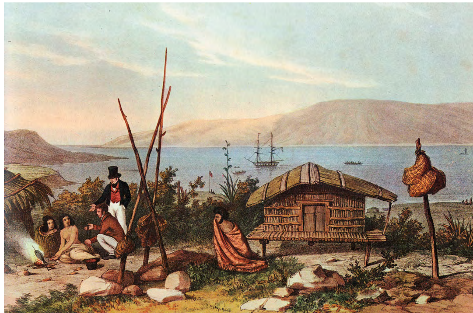
Britit ja maorit kohtaavat Pakanaen kylässä. Vuodelta 1827 oleva teos on Augustus Earlen tekemä.

Sen lisäksi että valikoimalla voidaan tuottaa erilaisia tietoja, valikoituihin todisteisiin vetoamalla on nykymaailmassa myös puo-