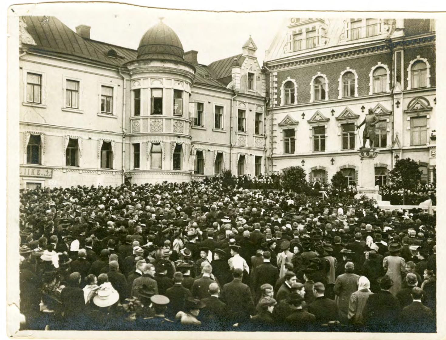
Vuonna 1908 Viipurissa pidettiin tilaisuus, jossa paljastettiin Torkkeli Knuutinpojan patsas. Sitä venäläiset pitivät lähinnä valtiopetoksena, ja osittain sen seurauksena he pystyttivät Viipuriin kaksi vuotta myöhemmin Pietari Suuren patsaan. Myöhemmin kyseenalaistetun tarinan mukaan Torkkeli Knuutinpoika johti ruotsalaisten itään suuntautunutta ristiretkeä, jonka aikana perustettiin Viipurinlinna.