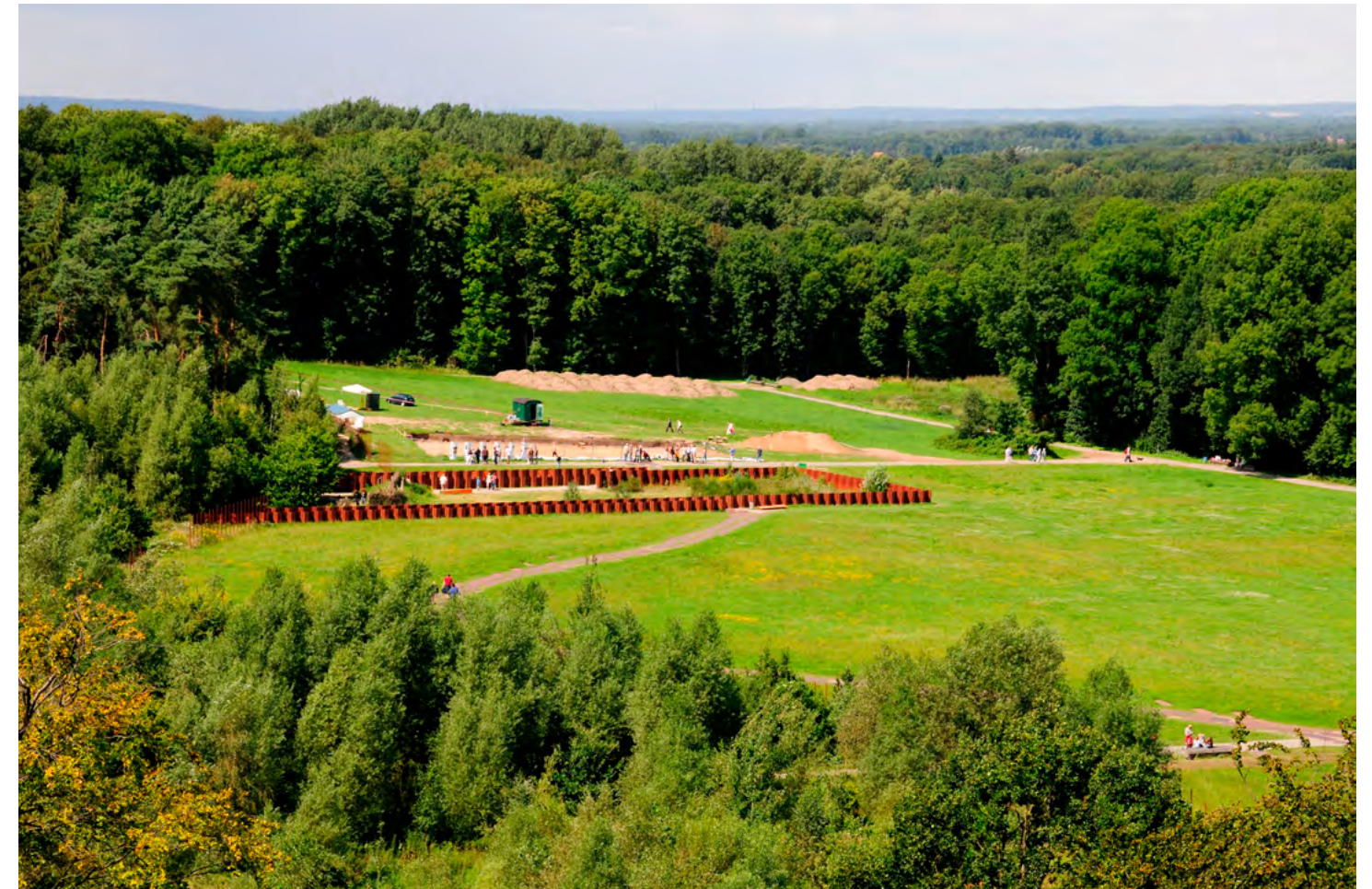
Nykyään katsotaan, että roomalaisten ja germaanien välinen ratkaiseva taistelu käytiin todennäköisesti Kalkriesessä. Paikalla sijaitsee nykyään museo ja puisto.