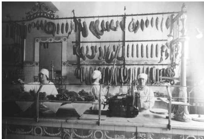
Helsingin historiallisen kartaston kuvitus on herkullinen. Elinkeinoista mainos- ja valokuvien sekä kartoin esitellään elintarvikekauppa.

Helsingin keskusta sai omat kilvinnansa 1800-luvun lopussa. Kirjan valokuvat osin jo hävinneistä rakennuksista kuvaavat hyvin niiden klassista luonnetta. Korttelien suurentuminen ja geometrisesti säännönmukaiset kokonaisuudet erottuvat kartoissa, joskin uteliaisuuden valtaamalle keski-ikäiselle lukijalle suurenuslasi on aika ajoin hyvä ystävä käytetyn symboliikan selitystekstejä etsiessä.