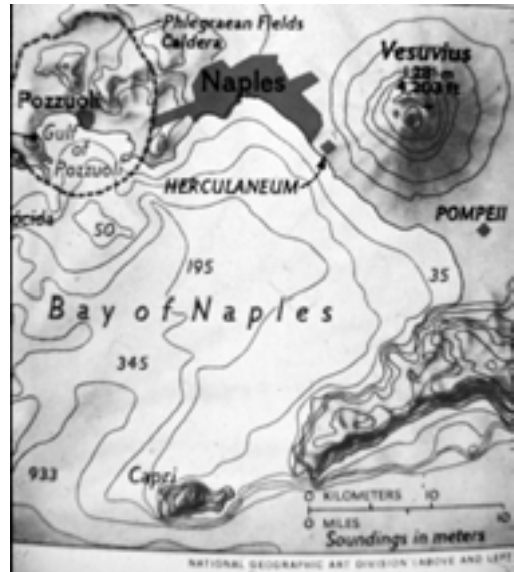
Kuva 1. Pompejin ja sen sataman sijainti Campanian muihin keskuksiin ja Vesuviukseen nähden.

Napoliin Bourbon-sukuiset kuninkaatsat rahoittivat Pompejin ja Herculaneumin ensimmäiset kaiva-