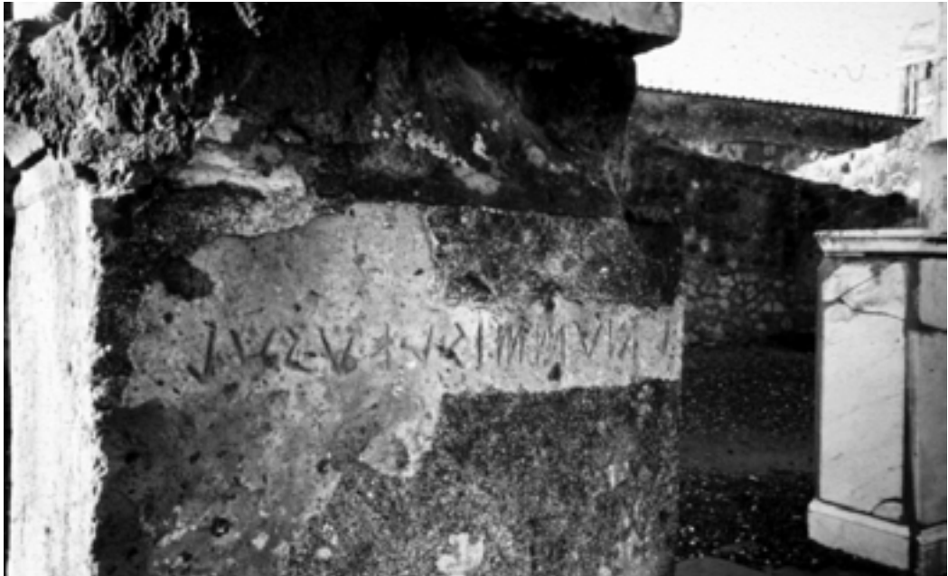
Kuva 5. Lucius Mummiuksen piirtokirjoitus

parempana kuin Julius Caesaria, mutta pian vastustus laantui, ja pompejilaisista tuli mitä innokkaimpia keisari Augustuksen kannattajia. Tämä ei ollutkaan aivan yhdentekevää, sillä keisariperheellä oli omistuksia sekä Pompejin alueella että sen lähipiirissä, ja keisariperhe kävi näillä seuduilla usein. Keisari Claudiuksen aikana olin havaitsevinani jonkinlaista häiriötä keskushallinnon ja Pompejin kaupunkihallinnon välisissä suhteissa ja olen hyvin kiinnostunut näkemään, voidaanko tämänkin ajatukseni uusien tutkimusten avulla osoittaa oikeaksi.