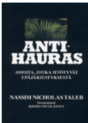
Nassim Nicholas Taleb: Antihauras. Asioita, jotka hyötyvät epäjärjestyksestä. Ovh. 50 €