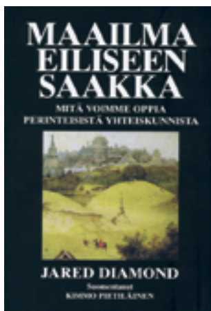
Jared Diamond: Maailma eiliseen saakka. Mitä voimme oppia perinteisistä yhteiskunnista. Ovh. 50 €

Hyvin varustetuista kirjakaupoista tai suoraan kustantajalta www.terracognita.fi