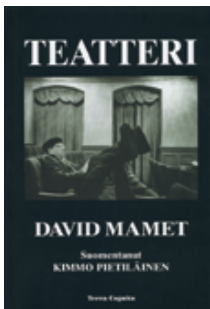
David Mamet: Teatteri. Ovh. 25 €