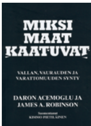
Daron Acemoglu ja James A. Robinson: Miksi maat kaatuvat. Vallan, vaurauden ja varattomuuden synty. Ovh. 50 €