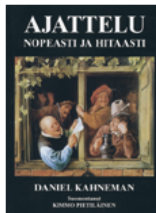
Daniel Kahneman: Ajattelu nopeasti ja hitaasti. Ovh. 50 €