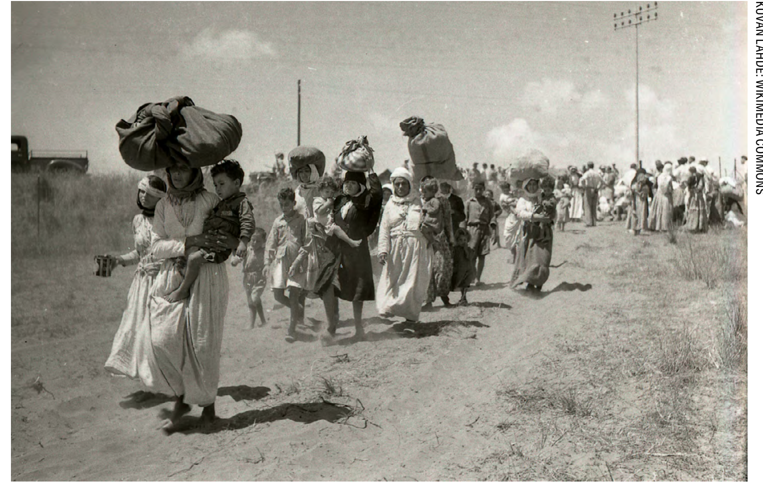
Tanturan kylän valtaus ja valtauksen jälkeinen joukkomurha vuonna 1948 nousivat Israelissa keskusteluun vuosituhannen vaihteessa, kun aiheesta ilmestyi muistitietohaastatteluihin pohjaava opinnäytetyö.

Tiedon tuotannon epätasa-arvoisuuden teema on keskeinen myös Palestiina/Israelia koskevassa länsimaisessa uutisoinnissa. Tämä tuli ilmi viime vuoden marraskuussa, kun Israelin joukot pommittivat al-Shifan sairaalaa. Israel väitti sairaalan toimivan Hamasin tukikohtana, minkä sairaalan työntekijät kielsivät. Monet tiedotusvälineet toistivat Israelin väittämiä niitä kyseenalaistamatta, vaikka