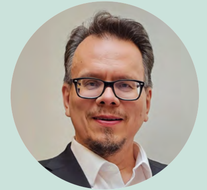
KUVA: HILKKA MIETTINEN

Avoimuuden infrastruktuurit tarvitsevat perustakseen toimivia teknologisia ratkaisuja, mutta ytimeltään ne ovat muutakin kuin teknologiaa. Avoimuus edellyttää muun muassa metatietoja julkaisuista ja niiden tekijöistä sekä näitä julkaisuja ja tekijöitä yksiselitteisesti identifioivia standardeitua tunnistejärjestelmiä (kuten ISBN, ORCID ja URN).