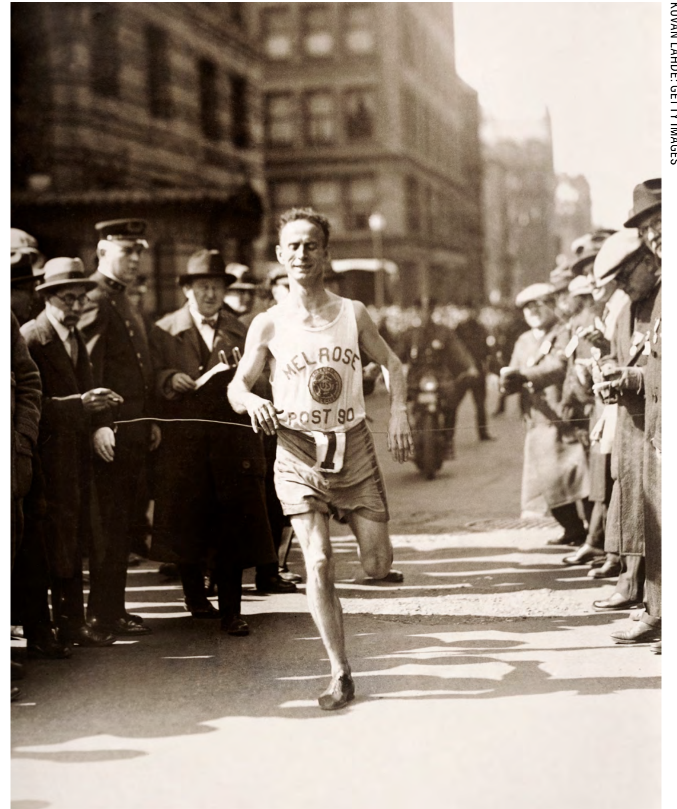
Clarence DeMar juoksee pronssille vuoden 1924 Pariisin olympialaisissa.