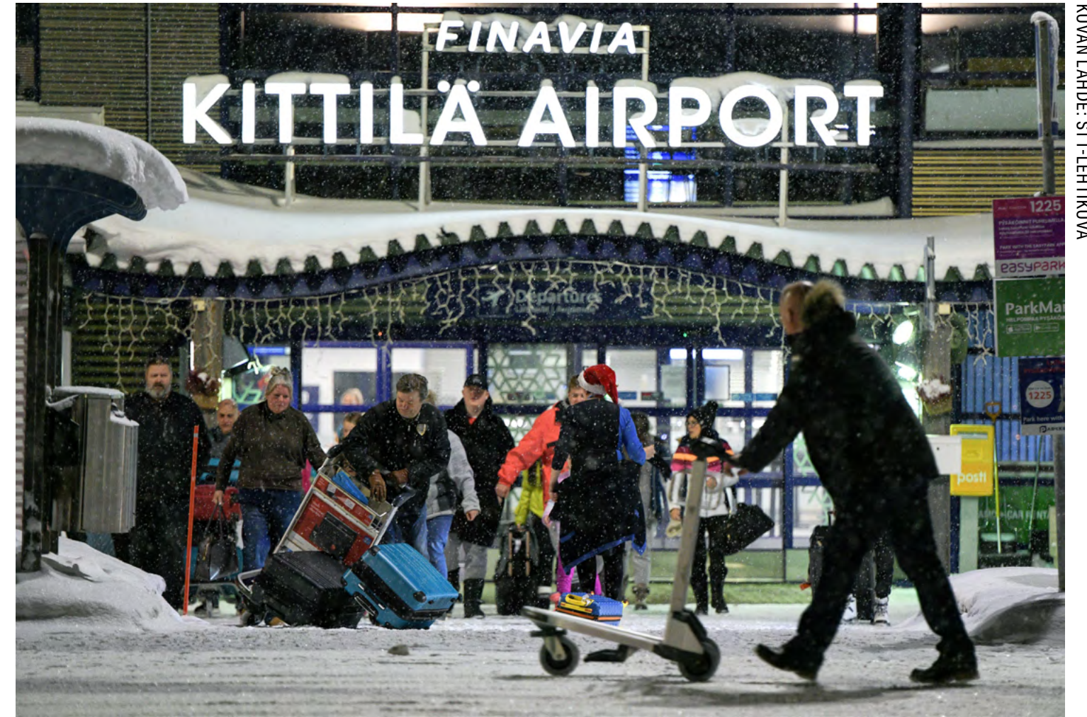
Kittilän lentoasemalle saapuu vuosittain yli 200 000 kansainvälistä matkustajaa, heistä valtaosa talvikuukausina lumen ja kylmyyden houkuttelemina.

Pitkinä pakkasjaksoina kylmyyden kauneus kukoistaa, kun ilmakehässä oleva kosteus tiivistyy huurteeksi puihin ja rakenteisiin. Urbaanit lähiöt ja teollisuusalueetkin alkavat yllättäen näyttäytyä kuvauksellisina kohteina. Tällaiset tilanteet syntyvät ainoastaan tuulettomina kylminä päivinä. Värähtelemättömät puut korostavat jäätyneen ympäristön seesteisyyttä ja harmoniaa. Aika tuntuu pysähtyneen. Tällaiset kokemukset ovat hyvin vaikuttavia, usein myös rauhoittavia ja jopa terapeutisia.