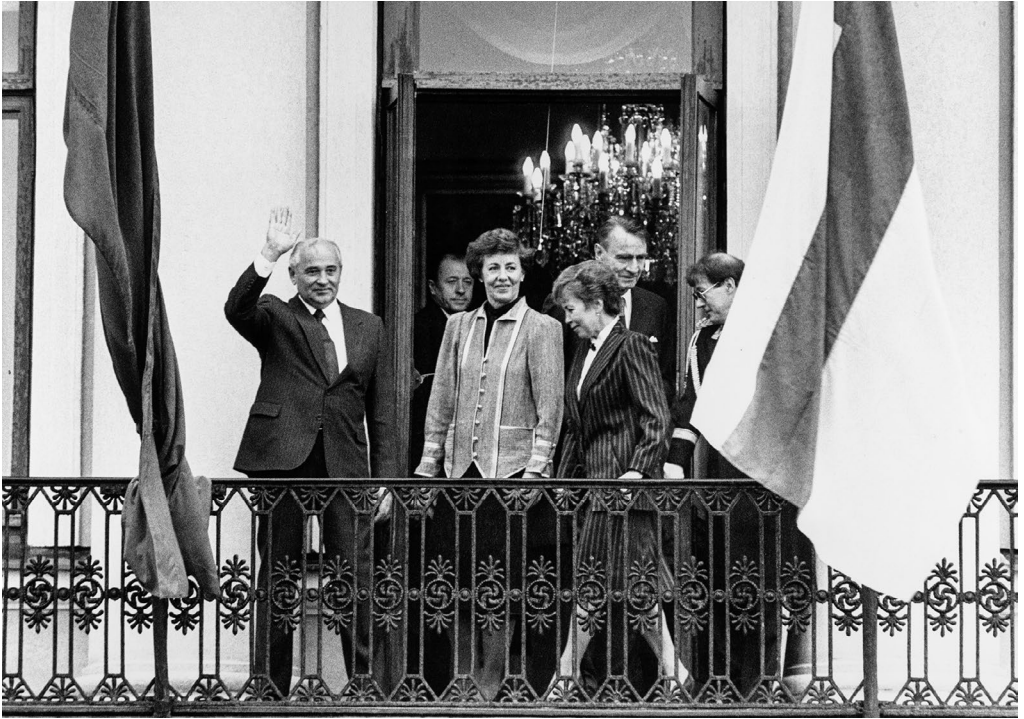
Kaksi presidentillistä pariskuntaa. Koivistot ja Gorbatsšovit Presidentinlinnan parvekkeella neuvostopresidentin Suomen-vierailulla lokakuussa 1989.

etuja niin harvoille, mutta kahlitsee ja vaikuttaa niin monien elämää?” 10