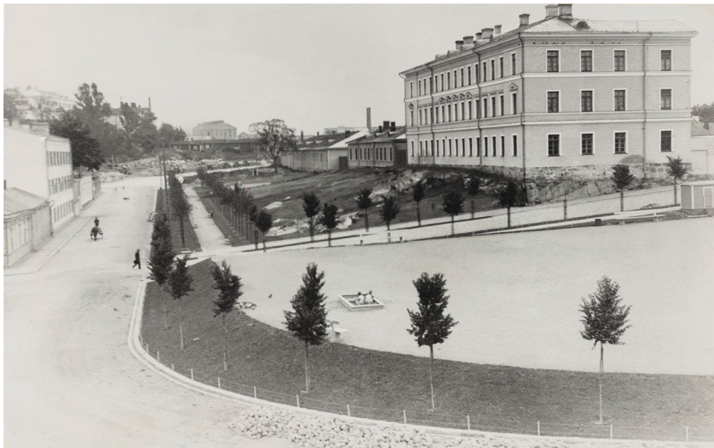
Kurjenkaivonkentän viereinen mäki tunnetaan nykyään Sirkkalan kasarmina. Vuosina 1918–1923 alueella toimi punakaartilaisten vankileiri, ja leirin lakkauttamisen jälkeen alue siirtyi armeijan käyttöön sotilassairaalaksi. Vuosina 2006–2020 kasarmialueella sijaitsi Turun yliopiston historian, kulttuurin ja taiteiden tutkimuksen laitos. Museovirasto on määritellyt kasarmialueen valtakunnallisesti merkittäväksi rakennetuksi kulttuuriympäristöksi. Valokuva alueesta on otettu vuonna 1934.