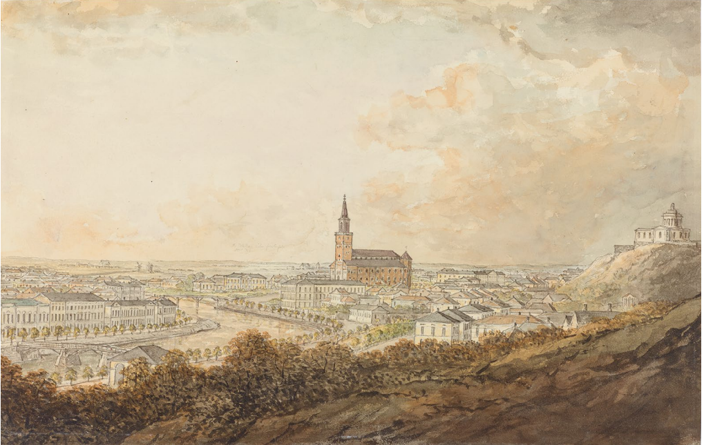
Taiteilija Carl Johan Fahlcrantzin näkemys Turun kaupunkikuvasta ja jälleenrakentamisen etenemisestä vuodelta 1841.

mukaan saanut kuitenkin rakentaa uudisrakennuksia, vaan näin toimittaessa vanha tontti olisi pitänyt uudistaa Engelin asemakaavan mukaisesti. 31