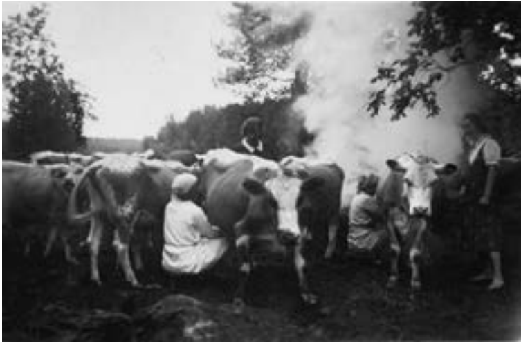
Kuva 1. "Iltalypsyllä lehmisavujen kera lisalnessa." Kuva: DIGI – Yleisten kirjastojen digitoimaa aineistoa, viitattu 1.9.2023, https://digi.kirjastot.fi/items/show/124840 .

aikaan lehmille varattiin parempia suupaloja, kuten juomaa ruis- ja kaurajauhoista.