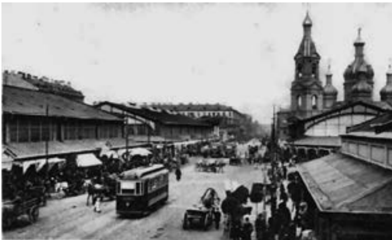
Kuva 3. Heinätori Pietarissa noin 1910-luvulla. https://commons.wikimedia.org/wiki/File:MBTram-16.jpg?uselang=ru .

Vientivoi pakattiin meijereissä huolellisesti pestynä, mikä tarkoitti, ettei nestettä saanut olla mukana. Myös suolaus oli tärkeää. Vientivoi erosi maalaisvoista eli kotona kirnutusta voista, vaikka sitäkin käytiin kauppaamassa Venäjän puolella. Kun katsoo kuvaa Pietarin kaupungin Heinätorista, voi ehkä kuvitella näkevänsä voikauppiaan. (Kuva 3)